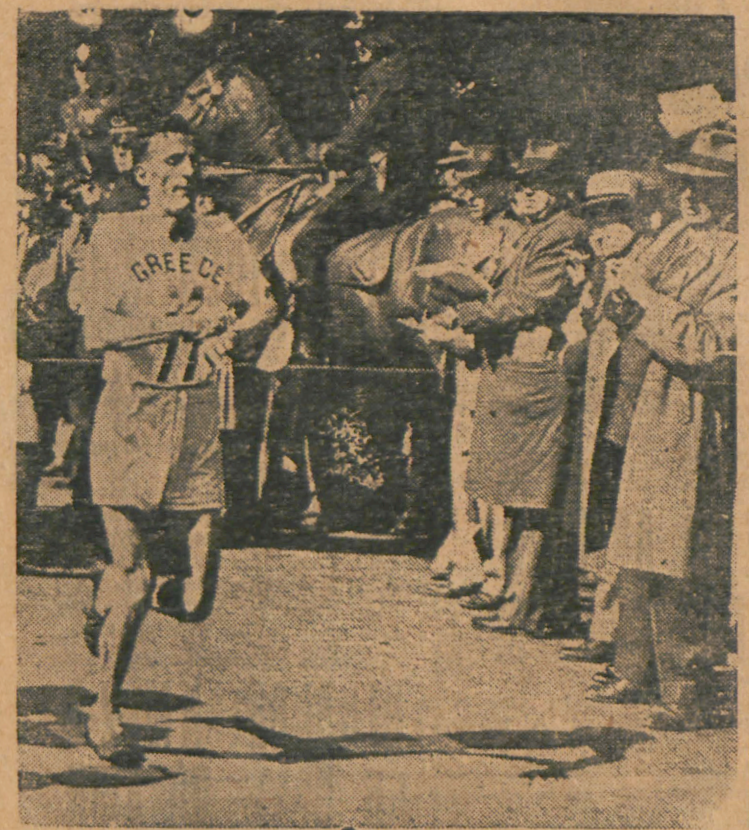
Ο ιστορικός τερματισμός του ένοχου Μαραθωνοδρόμου μας Κυριακίδη εις τόν Διεθνή Μαραθώνειον τής Βοστώνης. Είς τόν Όσλο δραπε τον περιμένει τέλειος θρίαμβος; Τι λέει τόν βιβλίον τής Μοίρας; Τι λέει ή φόρμα του;

ΘΑ ΣΥΝΑΓΩΝΙΣΘΗ ΣΤΟΝ ΜΑΡΑΘΩΝΕΙΟΝ ΤΟΝ ΒΑΛΚΑΝΙΟΝΙΚΗ ΜΑΣ ΡΑΓΑΖΟ ΚΑΙ ΤΟΝ ΘΡΥΛΙΚΟΝ ΔΡΟΜΕΑ ΤΩΝ ΣΟΒΙΕΤ ΕΙΣ ΤΑ 100 ΧΙΛΙΟΜΕΤΡΑ ΣΙΜΙΤΣΕΝΚΟ!