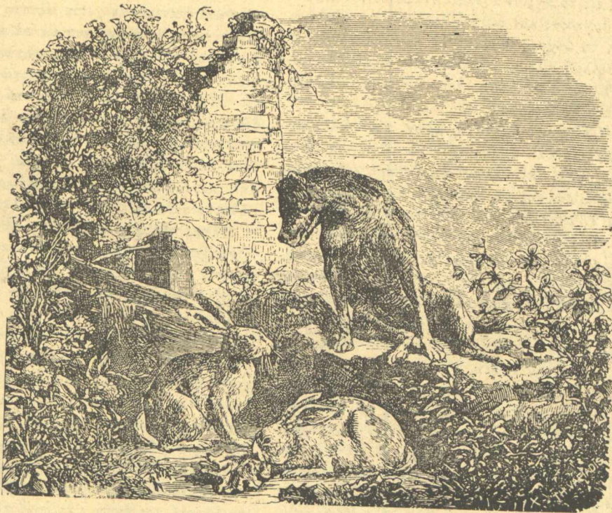
Οἱ δύο ξένοι ἐτέθησαν ὑπὸ τὴν προστασίαν τοῦ Λύκου (Σελ. 183).

Ἄμα ἐφθασεν εἰς τὴν κωμόπολιν δὲν ἤργησε νὰ εὕρη ἀγοραστὴν διὰ τὰ χόρτα τῆς. Ξενοδόχος τις τὰ ἠγόρασεν ὅλα ἀντὶ τεσσάρων γροσίων, ἀλλὰ ἐγέλασε καὶ αὐτὸς διὰ τὴν ιδέαν,