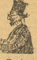
Ὁ Πάτερ Παχώμιος

Ἴδου ὁ νυμφίος ἔρχεται ἐν τῷ μέσῳ τῆς νυκτός, καὶ μακάριος ὁ δούλος ὃν εὐρίσκει μὲ τὴν δούλα, ἀναξία δ' ἀφ' ἑτέρου ὅποια μένει μοναχοῦλα στὸ κρεβάτι τῆς περμένη κρῶα καὶ ξεπαγιασμένη. Γιατὶ μέσ' σ' αὐτὸ τὸ κρῶο - ποῦ ὅπως λέν: καιρὸς γιὰ δύο ἄξιον καὶ δίκαιον εἶνε τῆς ψυχρῆς τῆς νύχτες νᾶχη ἔναν ἄνδρα, ἢ καῦμένη! στὸ πλεῖρό νὰ τὴν ζεσταίνῃ. Κι' ἂν μαζύ του ἀμαρτήτῃ, θάχῃ γιὰ παρηγοριά πῶς θὰ βοῆ ἐπὶ τέλους ἐέστη στῆς κολάσεως τῆ φωτιά