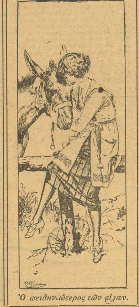
Ὁ weirder τῶν γῆραν.

Ἐνεκα πληθώρας ὕλης ἢ συνέχεια τοῦ «Φαντομά» ἀναβάλλεται διὰ τὸ προσεχές.