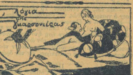
Η ΠΡΩΤΟΜΑΡΙΑ ΜΟΥ