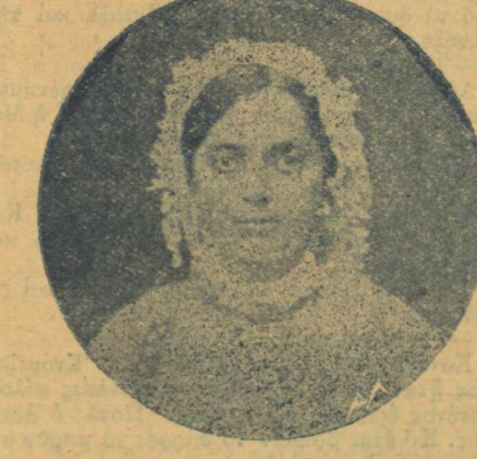
Βοσκοπούλα του Παργασού (έκ Λαδίου)