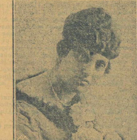
Έλευθερία (έκ Αθηνών)