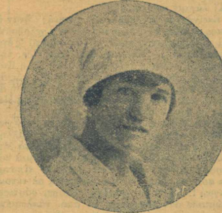
Παρήγορος Τραυματιών (έκ Σεργών)