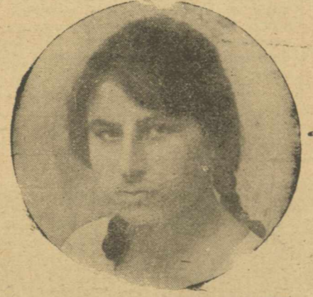
Δαίς η Κορινθία (εξ Κορινθου)