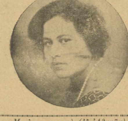
Μελαχροινή (εξ Αθηνών)

ΣΕΜΝΟΥΦΗ Ματια του γάιφανα χαμηλωμένα, παρθένα γειλη σά ματωμένα, βάδιση' ανάλαφρο και γροχαλό, να ένα κορίτσι πουν' γνωστικό. Σ' όλα του μέτρο, χαριτωμένο, μ' εδγένεια, χάρη και προκομένο, καρδιά μεγάλη κι' εσπικλαγνικά που άλλη δεν έχει στη γη καμιά. Τι πλάσμα αιδέου, τι καναγιά! —Καλέ τι λέτε, τι... όπορσιόσια! Νίκος Γρυπιοσιώτης