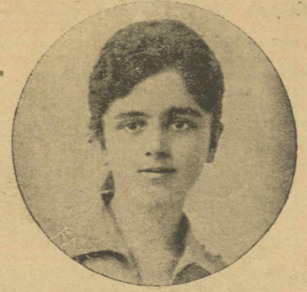
Μήλον της Έριδος (εξ Θράκης)

ΠΑΝΤΟΥ ΚΑΙ ΠΑΝΤΑ Τ' ΑΝΙΣΟ Περπατώντας τη ζωή, μαρτυρικά τη νοιώθω σαν να μου λη έννοια τον κρύφιο τον κόθο. Ποθείς... αν και τ'ό βλέμμα σου δε φθάνει [πολύ πέρα, για να πετάξης σ' άλλους, πλην, άγνωστον [άστέρη]. Δε σε άρκει, της γής εδώ, —εινε στενός— [χώρος... Ποθείς σε τόκουσ τ' άγνωστου να γίνης όδοι- [πόρος, "Ω! ναί! να ζής βαρβήρες σ' άπαισιο τουτο [μνήμα, που βασιλεύη άπελπισία, και τ' άδικου το κριμα, Τό βλέπω... νοιώθεις μέσα σου, φρικτη μονοτονία, και πουθενά... μά πουθενά, δε βλέπεις άρμονία! Παντο, και πάντα τ' άσχημο, και τ' άνισο [κροβάλλη, γιατί τό κάθε αγαθό, ή βία περιβάλλει! Άθήνα, Άγγελος Χρονόπουλος ΤΑ ΨΕΥΔΩΝΥΜΑ «Άκαρηγόρητος» Φλογερός Έρωας «Άτυχης έρωτευμένος» Χαραυγή.