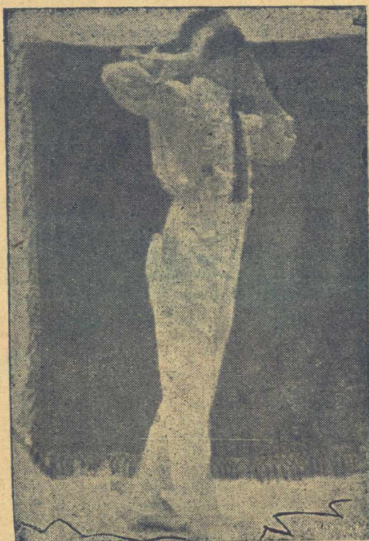
Ο κ. Γ. ΜΑΪΧΟΣ ΕΚΤΕΛΩΝ ΤΑ ΠΕΙΡΑΜΑΤΑ ΤΟΥ