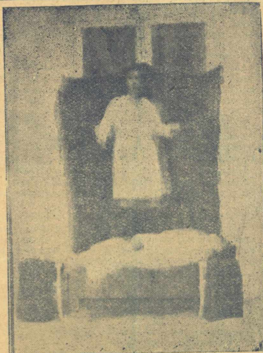
Ἡ καταληψία: Ἐπάνω στὴν κοιλία του ἔχει ἀνέβει ἡ φοιτήριά του ἐνῶ αὐτὸς ἔχει πᾶθει καταληψίαν

Περῶ βελόνες 15 πόν- των ἀπὸ τὰ μάγουλά του καὶ τὰ χέρια του χωρὶς καμίαν ἔνεσιν,