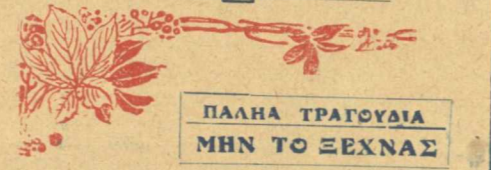
ΠΑΛΙΑ ΤΡΑΓΟΥΔΙΑ ΜΗΝ ΤΟ ΞΕΧΝΑΣ