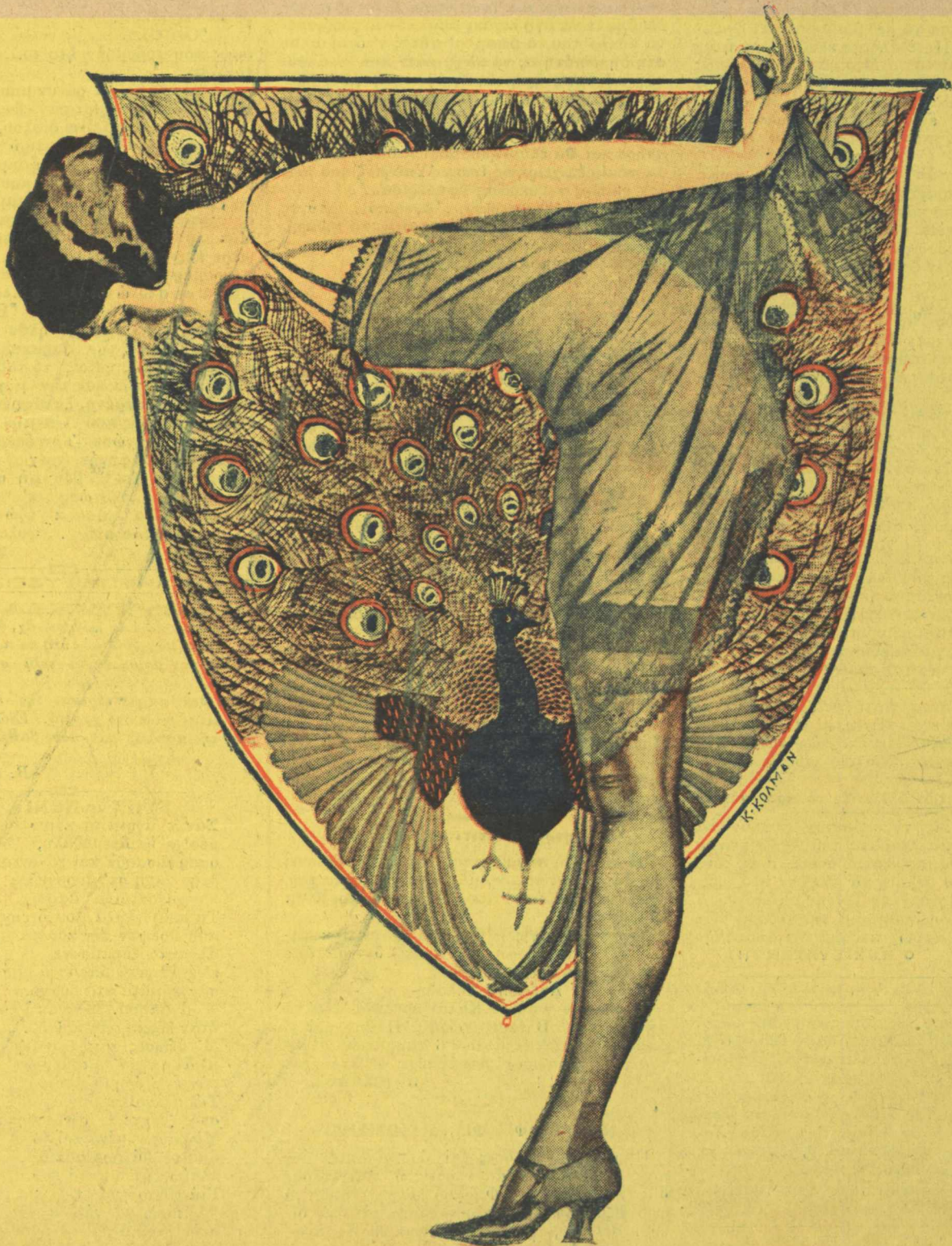
Ο ΧΟΡΟΣ ΤΟΥ ΠΑΓΟΝΙΟΥ