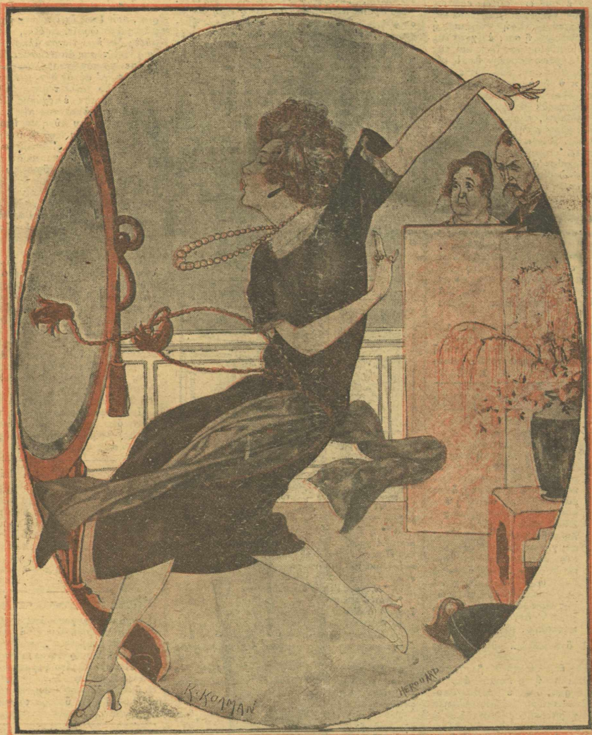
Η ΜΑΜΑ ΚΙ Ο ΜΠΑΜΠΑΣ ΠΑΡΑΚΟΙΟΥΘΟΥΝ ΤΗΣ ΠΡΟΒΟΥΣ ΤΗΣ ΚΟΡΗΣ ΤΩΝ