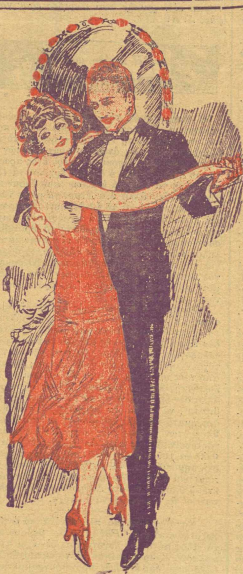
Μία φιγούρα ἀπὸ τὸν νέον χορὸν «Φάιβ-στέπ». Δανσάρεται στὰ Ντάνσιγκ τῶν Ἀθηνῶν.

Ψηφίζω . . . . . Ὄνομα ψηφοφόρου . . . . .