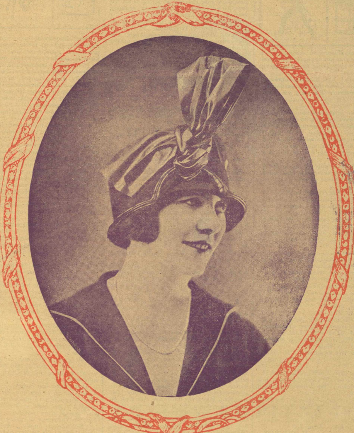
Ἡ ΜΟΔΑ: Τὸ καπέλλο νεκρὸν οὐκ ἐπι- καταί ἀπὸ Παρισι.