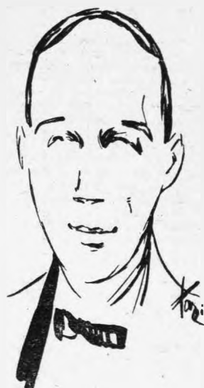
(Σκίτσα: Ἄντ. Πρωτοπάτης)

Οἱ ἀνάμνησες μου γύρω στὸν ἐκλεκτὸ αὐτὸν λογοτέχνη, πού τόσο πρόωρα τὸν χάσαμε, περιορίζονται σχεδὸν στὶς παλιές ἐκείνες διαπλαστικές. Μόνο ὅσο ἦταν συνδρομητής κι' ἐρχόταν ἀπὸ γραφεῖο, βλεπόμαστε συχνὰ καὶ μιλοῦσαμε γιὰ τὰ πράγματα πού ἐνδιέφεραν καὶ τοὺς δύο μας. "Ἐπειτα χωριστήκαμε. Πολὺ σπάνια συναντοῦσα ἔξω τὸν Λαπαθιώτη, καὶ μόνο κάπου-κάπου λάβαινα κανένα γράμμα του, γιὰ ζήτημα πάλι πού ἐνδιέφερε καὶ τοὺς δύο μας. Κάναμε βλέπετε πολὺ διαφορετικὴ ζωὴ. Ἐκεῖνος κλεισμένος ἅλη τὴν ἡμέρα στὸ σπῆτι του, δὲν ἔβγαινε παρὰ τὴ νύχτα ἀργά, γιὰ νὰ γυρίσῃ ἔξω σχεδὸν ὡς τὸ πρωτὶ. Ἐγὼ, ἀπεναντίας, μόνο τὴν ἡμέρα φαινόμωνα στὰ κέντρα — κι' ὄχι πολὺ ταχτικά — ἐνῶ τὴ νύχτα κλεινόμουν στὸ σπῆτι μου γιὰ νὰ ἐργασθῶ καὶ νὰ κοιμηθῶ. Αὐτὸς εἶναι κυρίως ὁ λόγος πού ὁ Λαπαθιώτης δὲν εἶχε μαζί μου τὴν ἐπικοινωνία πού εἶχε με ἄλλους λογοτέχνες... Ἐξενύχτηδες, μάγαποῦσε ὅμως ἐξαιρετικὰ σὰν ἄνθρωπο — ἴσως καὶ σὰ διηγηματογράφου, αὐτὸ δὲν τὸ ξέρω — καὶ μοῦ τὸ ἔδειχνε κάθε φορὰ πού μ' ἔβλεπε ἢ λάβαινε ἀφορμὴ νὰ μοῦ γράψῃ. Τελευταίως, ἐνῶ εἶχα πολλὰ χρόνια νὰ τὸν ἰδῶ, ἔλαβα ἑαφνικὰ ἕνα γράμμα του. Μοῦ ἔλεγε πὼς αἰσθανόταν ἐπιτακτικὴ τὴν ἀνάγκη νὰ ἰδωθοῦμε ἄλλη