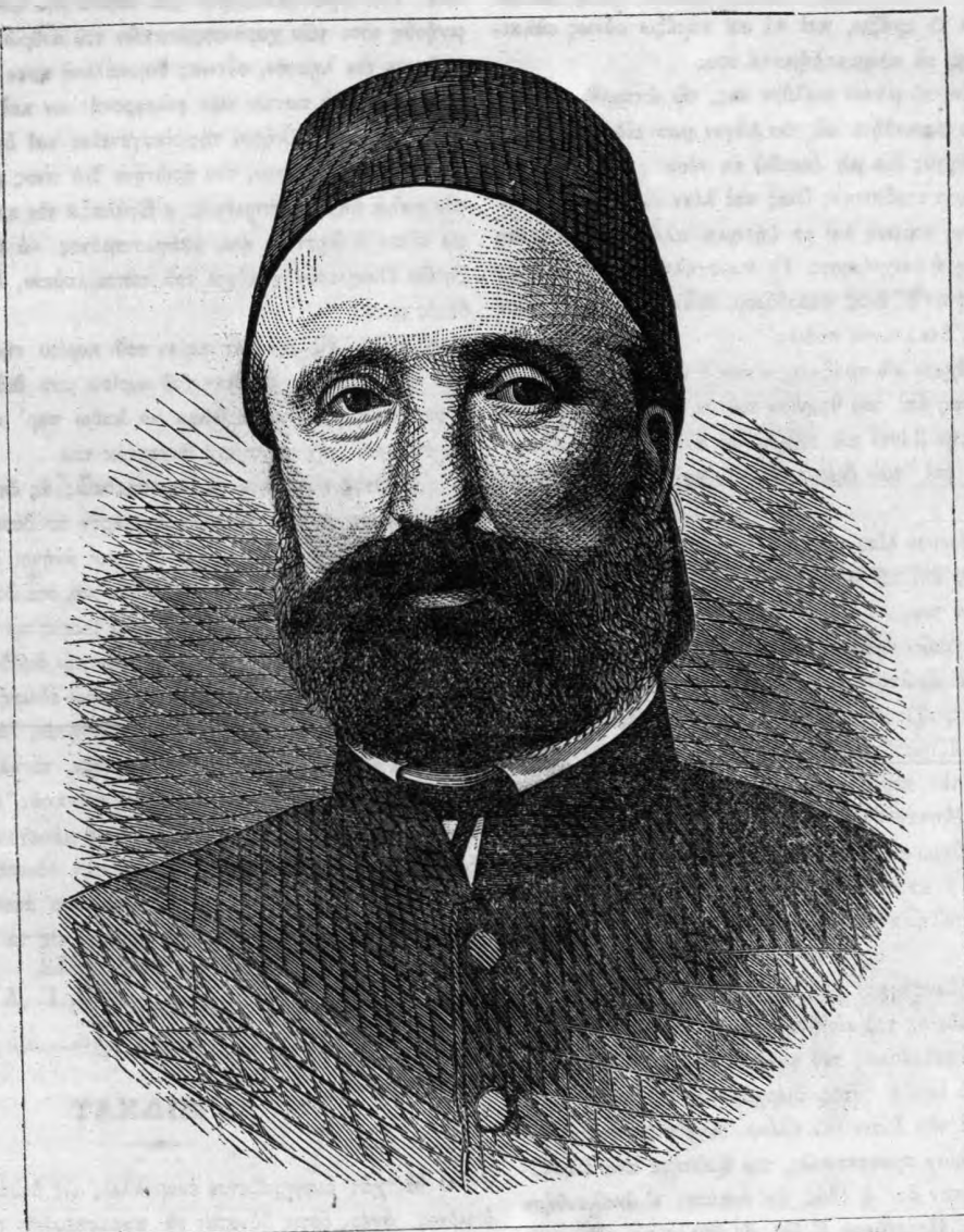
ΜΙΔΧΑΤ ΠΑΣΣΑΣ ὁ νέος Βεζίρης.

Ὁ δὲ Ἀγγλικὸς « Χρόνος » ἰδοῦ τί ἔγραψε περὶ τοῦ ἀνδρός. Τοῦ Μιδχάτ ἐξυμνεῖται ἡδύνοια, ἡ τιμιότης, ἡ εὐψυχία καὶ ἡ ἀκάματος φιλοπονία. Ἀνομολογοῦντες καὶ ἡμεῖς τὸν ἱκανότητά του ἐνθυμούμεθα ὅτι αὐτὸς ἀπεδείχθη εἰς τῶν ἀρίστων ἐπαρχιακῶν κυβερνητῶν ἐν Τουρκίᾳ. Ἐν Βαγδάτ ἐνεκαίνισε τὴν τάξιν καὶ κατέβαλε τὰς πρώτας βᾶσεις τῆς ἡμερῶσεως· ἂν τὸν μνησθῶσιν οἱ διὰδοχοὶ του, ἡ γῶρα ἐκείνη, ἡ ὑπὸ τοῦ Θεοῦ εὐλογημένη καὶ ὑπὸ τῆς ἀσχαρῆωθίσεως ἀνθρωπότητος κατηραμένη, θὰ ἀποδοθῇ εἰς τὸν πολιτισμὸν πρὸς χάριν τῶν εὐρωπαϊκῶν ἐθνῶν. Ὁ Μιδχάτ ἔχει ἀρίστα προσέσεις καὶ ἱκανότητα, ἐφ' οἷς ἠδύνατο νὰ διαπράξῃ ἐπιτυχῶς.