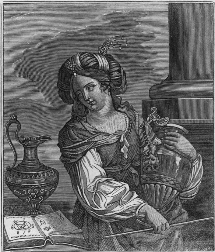
Ἡ ΜΑΓΙΣΣΑ ΚΙΡΚΗ.

Ἐπρεπε νὰ πληρώσω τὸ ἐνοίκιον τοῦ δωματίου μου καὶ ἄλλα μικρὰ ἔξοδα, ἀνωρελῶς τρέχουσα πρὸς εὐρεσιν θέσεως. Ἦδη, δὲν μοὶ μένει πλέον τίποτε. Ἐκείνη τῇ ἡμέρᾳ χειροτερεύει τὴν θέσιν μου. Νὰ μὴν ἔχω ἕνα φίλον! Νὰ μὴν ἔχω πλέον μίαν ἐλπίδα, ἐν