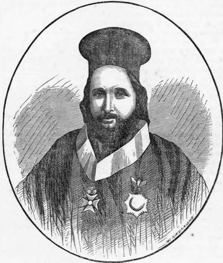
Ο ΧΙΟΥ ΓΡΗΓΟΡΙΟΣ.