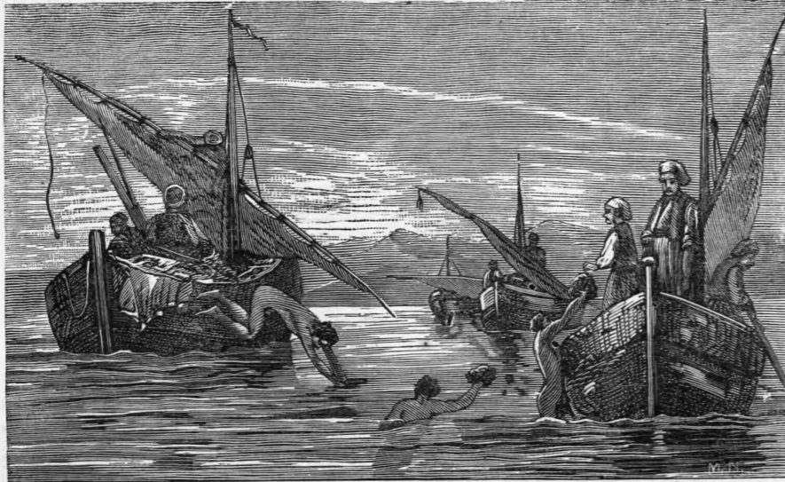
Σπογγαλιείς του Συριακού πελάγους.

έντος γλυκέος επανειλημμένως ανανεούμενου, μέχρις ου καθαρισθώσιν απο της βλαίνης. Μετά ταύτα τους διαπερῶσι διὰ θερμού ὕδατος, ἕνα λείψη ἀπ' αὐτῶν ἡ δυσωδία, τὴν ὁποῖαν ἔχουσι ἕνεκα τῶν ἐν τῷ ἰνῶδι ὑφάσματι ἐμπερικεικλισμένων ζωύφιων.