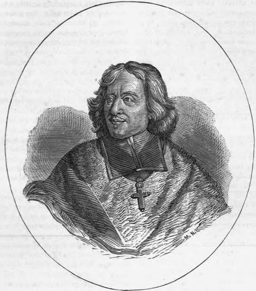
Βοσσουέτος Ἰάκωβος Βενέδικτος.