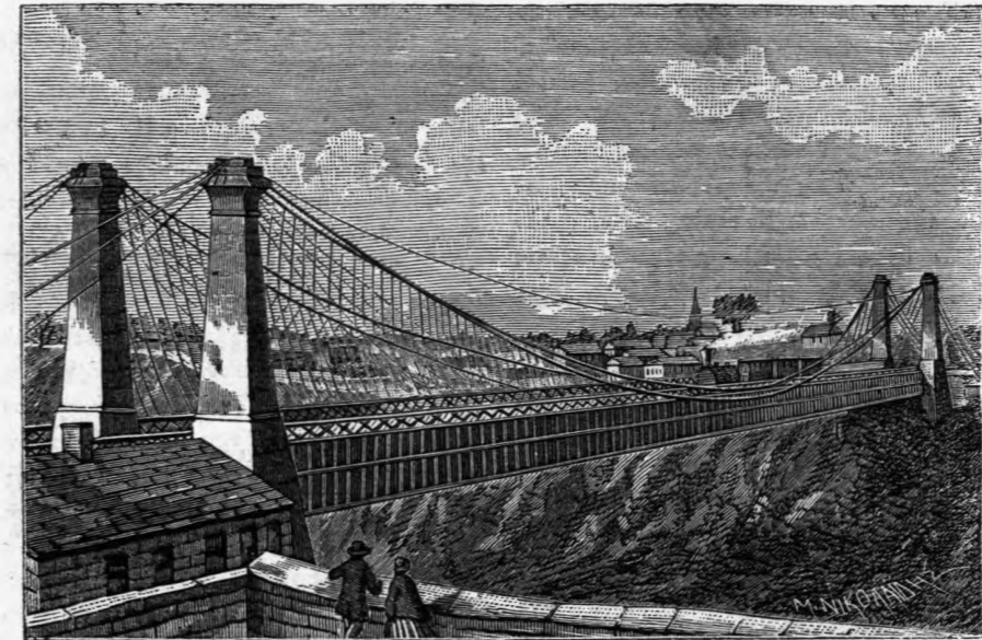
Ο ΚΑΤΑΡΡΑΚΤΗΣ ΤΟΥ ΝΙΑΓΑΡΑ ΚΑΙ Η ΚΡΕΜΑΣΤΗ ΓΕΦΥΡΑ.

Ἄπαντες οἱ περιηγηταὶ ἀποφαίνονται ἐτι ἐν βλέμμα πρὸς τὸν καταρράκτην τοῦτον εἶνε ἀντάξιον ὀλοκλήρων τόμων πε- ριγραφῆς καὶ τῶν ἐλαχίστων αὐτοῦ λεπτομερειῶν. Ἐνώπιον τοῦ θαύματος τοῦτου τὸ πνεῦμα ἐκπλήσσεται καὶ βιβλεῖα σιγῆ θαυ- μασμοῦ εἶνε ὁ συνήθης φόρος, δι' οὗ ἐτιμῆθη ὑπὸ τῶν ἐνδοξοτέ- ρων αὐτοῦ ἐπισκεπτῶν καὶ μ' ἔδον τοῦτο ὁ περίφημος μυθιστο- ριογράφος Δίκενς, ἰστάμενος ἐπὶ τοῦ τραπεζοειδοῦς βράχου (Table-Roch), θέσεως ἐπικινδυνωδεστάτης ὑπὸ τὸν καταρράκτην, ἐξεφώνησε καταπεπληγμένος: ποῖαι εἰσὶν αἱ κραυγαὶ αὐταὶ αἰ