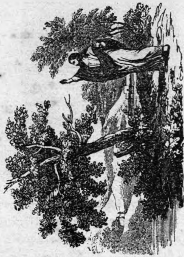
Ὁ Ἰησοῦς καταβάται τὴν σκῆν

Μεγά Σάββατον. Τὴν Θεόσωμον Ταφὴν και τὴν εἰς ἄδου Κἀθόδον τοῦ Κυρίου ἡμῶν