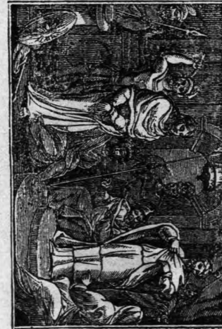
Ὁ Ἰησοῦς πρὸ τοῦ Πλάτου.

Περὶ τῆς Ἀναστάσεως τοῦ Κυρίου. Ἀπὸ τῶν πρώτων χρόνων τῆς συγκροτήσεως τῶν τοῦ θεοῦ Ἐκκλησιῶν, ἡ ἐορτὴ αὕτη θεωρεῖται, ἡ σπουδαιότερα και μεγίστη, ἐχακρακτῆριζον δὲ αὐτὴν διάφορα ὀνόματα. Καλεῖται ἡμέρα ἁγία, κλητὴ, ἡμέρα Κυρίου κορωῖς ἐορτῶν. Πάσχα ἁμωμοῖ. Πίσχα μέγα, Πίσχα τῶν πιστῶν, Πίσχα