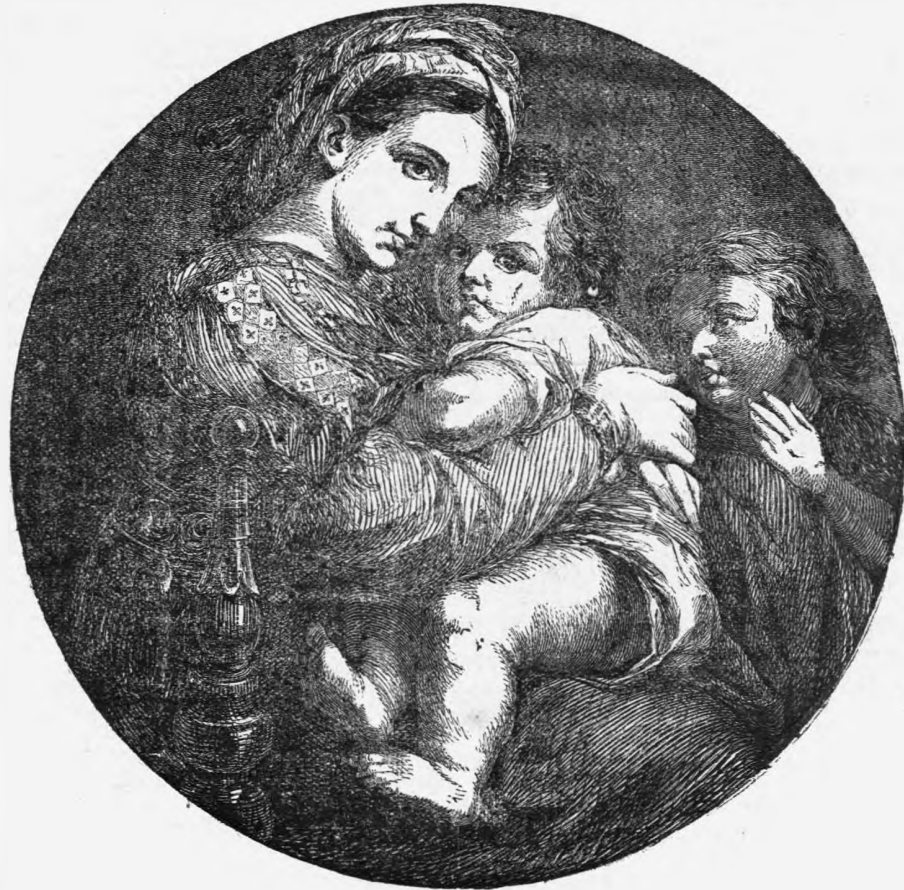
Η ΠΑΡΘΕΝΟΣ ΕΠΙ ΘΡΟΝΟΥ

Ἄλλ' εἶνε ἀδύνατον νὰ περιγράψῃ τις ἅπασας τὰς εἰκόνας τοῦ Ραφαήλ, χωρὶς νὰ κοπιᾷ τὸ πνεῦμα τοῦ ἀνεκφράστου διὰ συνεχῶν