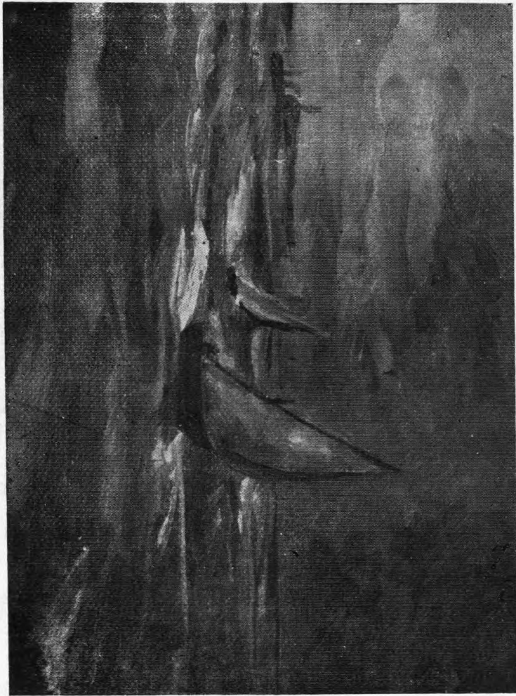
ΣΟΡΟΚΑΑ ΥΠΟ ΓΕΡ. ΒΑΚΟΥ

ξεως. 1 Δέν βλέπομεν συνήθως τὸ θέατρον νὰ ἐξασκῆ πραγματικὴν ἐπίδρασιν ἐπὶ τῶν ἠθῶν. Ἀντιθέτως τὰ ἠθῆ ἐπηρεάζουν τὸ θέατρον. Ἄλλ' ὅσφ χιμαιρικαὶ καὶ ἂν ἦσαν αἱ ἐλπίδες των, ἠδύνατο ἄρα γε ὁ Γκαίτε καὶ ὁ Σίλλερ νὰ ἐπιχειρήσουν κατὶ διάφορον ἐκείνου, τὸ ὁποῖον ἐπεχείρησαν εἰς Βαϊμάρην; Ἡδύνατο νὰ ἰδρύσουν μεγάλο λαϊκὸν θέατρον χωρὶς τὰ μέσα, τὰ ὁποῖα παρέχουν μία μεγαλοῦπολις καὶ ἕνα πολυάριθμον κοινόν;