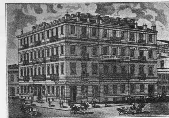
ΤΟ ΜΕΓΑ ΞΕΝΟΔΟΧΕΙΟΝ ΤΗΣ «ΑΓΓΑΙΑΣ».

Νέος καὶ αὐτὸς φιλοπρόοδος, καὶ ἄνθρωπος τῆς δρᾶσεως, ἀντάξιος τοῦ αἰμνήστου θείου του, με εὐρωπαϊκὴν μόρφωσιν καὶ πολὺγλωσσοσ, με βιοικητικώτατον πνεῦμα καὶ φωτεινοτάτην ἀντίληψιν, κάτοχος δὲ, ὡς οὐδεὶς ἄλλος παρ' ἡμῖν, τῆς ξενοδοχικῆς τέχνης, ἦν ἐπὶ μακρὰ ἔτη ἐν τῇ ἀλλοδαπῇ ἐσπούδασεν, ὑπόσχεται νὰ ἀναγάγῃ εἰς ἀνωτέραν ἀκόμη περιωπὴν τὸ ἴδρυμα τοῦτο, τὸ ὅποιον δικαίως ὑπερφρανεύεται καὶ διὰ τὸν νέον του τοῦτον διευθυντὴν καὶ ἰδιοκτῆτην.