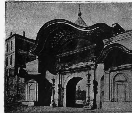
Η ΥΨΗΛΗ ΠΥΛΗ

Ἄλλ' ἐφύγατε ἐν μέσῳ τῆς τρικυμίας, εἰς τὸ πᾶθος τῆς ἡλικίας σας, πρὸ τῆς ὥρας σας ἀφήσατές με μόνον ἐν μέσῳ τῶν κινδύνων.