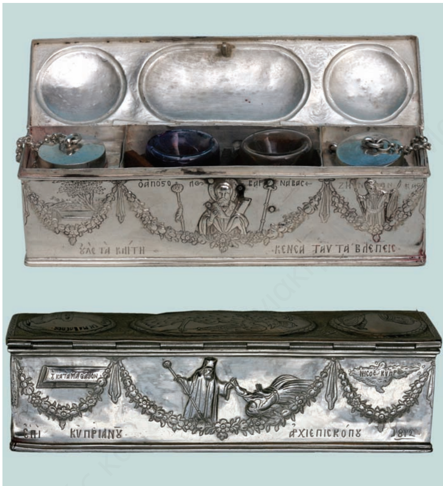
Τὸ μελανοδοχεῖο τοῦ ἀρχιεπισκόπου Κυπριανοῦ.

Βυζαντινὸ Μουσεῖο ἱερᾶς Ἀρχιεπισκοπῆς Κύπρου.