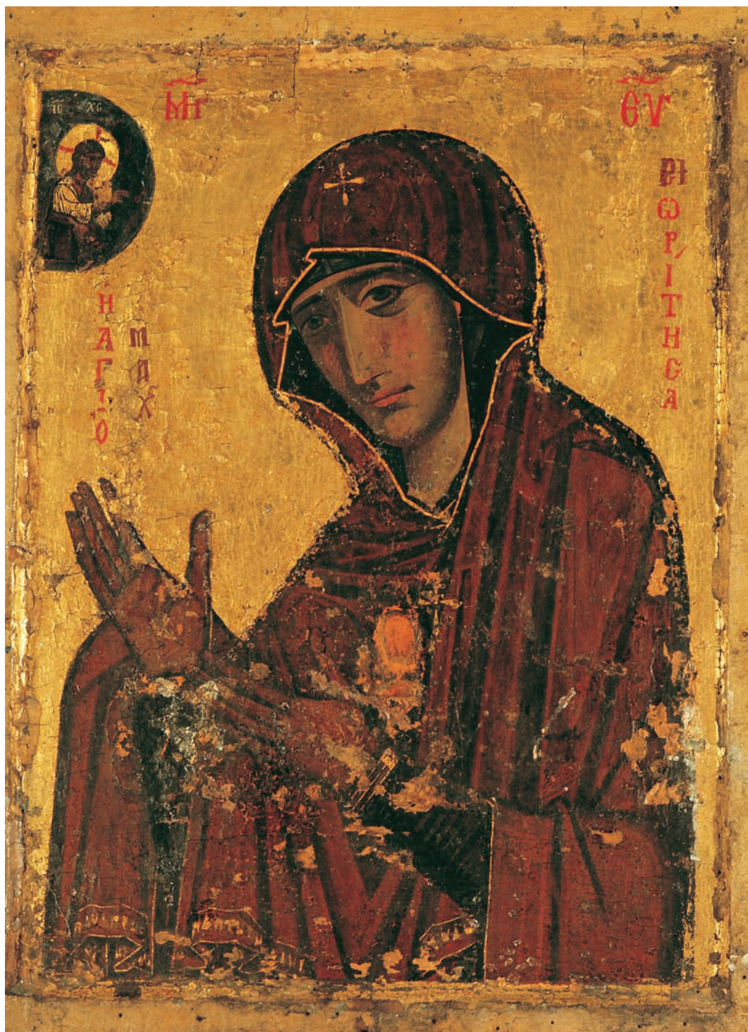
Ἡ ἐφέστιος εἰκόνα τῆς Παναγίας Μαχαιριώτισσης.