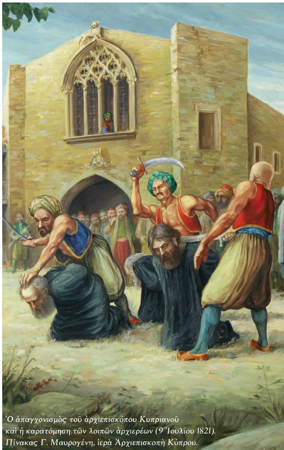
Ὁ ἀπαγχονισμὸς τοῦ ἀρχιεπισκόπου Κυπριανοῦ καὶ ἡ καρατόμηση τῶν λοιπῶν ἀρχιερέων (9 Ἰουλίου 1821). Πίνακας Γ. Μαυρογένη, ἱερά Ἀρχιεπισκοπὴ Κύπρου.