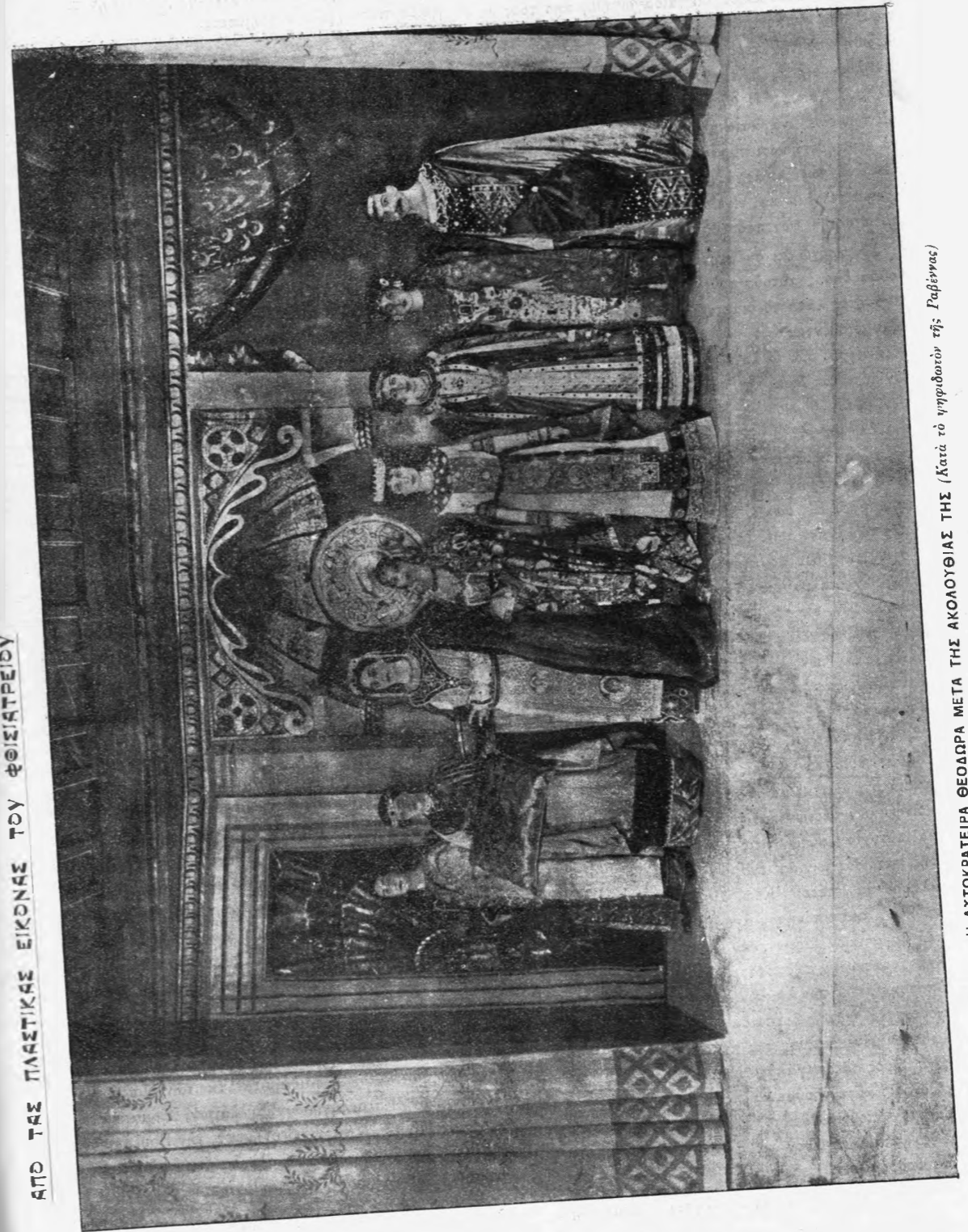
Η ΑΥΤΟΚΡΑΤΕΙΡΑ ΘΕΟΔΩΡΑ ΜΕΤΑ ΤΗΣ ΑΚΟΛΟΥΘΙΑΣ ΤΗΣ (Κατὰ τὸ μνημοεικὸν τῆς Γαβίννας)