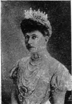
Η Βασιλίσσα Σοφία

Αυτό τó ιστορικόν παρελθόν συνδέει τó Έλληνικόν προς την πατρίδα της νέας βασιλείας μας. Έδώκαμεν βασιλίσσας εις την μακρινήν της χώραν και μάς έδωκεν Αύγουστας εις τó Βυζάντιον. Τρίτη άνέρχεται σήμερα τόν θρόνον τόν Έλληνικόν η Βασιλίσσα Σοφία. Η κόρη του Φρειδερίκου όμως δεν εχρειάσθη να μεταβάλλη τó όνομά της όπως τó εκάμαν αΐ δύο της πρόγονοι. Και ó Έλληνικός λαός ó όπως πιστεύει άνέκαθεν εις τας βουλὰς της θείας προνοίας φαντάζεται ότι θεία αντίληψις ηύδóχησεν ώστε εις τó αυτοκρατορικόν βρέ-