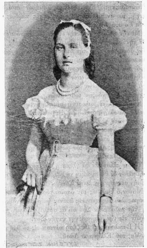
Ἡ Βασίλισσα Ὀλγα τὴν ἐποχὴν τῆς μνηστείας της

Πέρασαν πολλὰ χρόνια καὶ κατὰ τὸ διάστημα αὐτὸ ἡ Βασιλικὴ Οἰκογένεια τῆς Ἑλλάδος ἐποτίσθη μετὰ δάκρυα, ἐδοκίμασε πένθη καὶ θλίψεις, διήλθε στιγμὰς