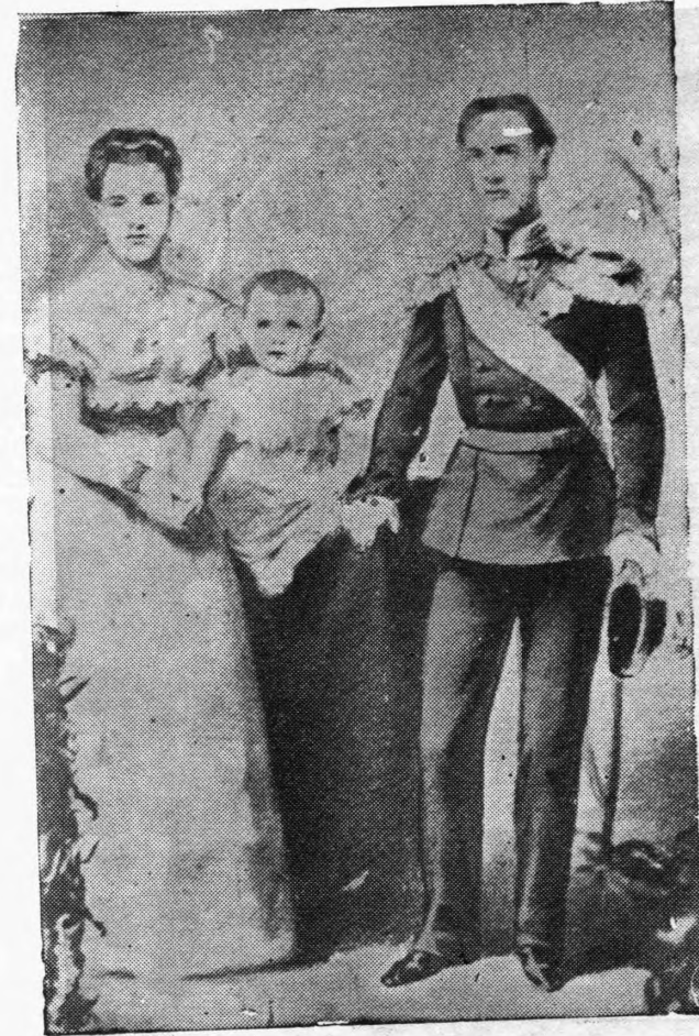
Όταν ἐγεννήθη ὁ Διάδοχος

Τούτο ἐδέχθη πρώτος ὁ Τσάρος Νικόλαος Α'. ἀγνωρίζας διὰ τῆς συνθήκης τῆς Βαρσοβίας τῆς 8ης Ἰουνίου 1851 τὴν ὑπὸ τοῦ Μεγάλου Δουκὸς καὶ κατόπιν Αὐτοκράτορος Παύλου γενομένην τῇ 1767 καὶ 1773 παρὰίτησιν τῶν τυχόν δικαιωμάτων του ἐπὶ τοῦ θρόνου τῆς Δανίας ὡς ἰσχυρὰν καὶ μετὰ τὴν ἐξάλειψιν τῆς βασιλευούσης ἐξ ἀρρενογονίας γραμμῆς, ἐὰν ὁμοῦ ὁ θρόνος περιέβη εἰς τὸν Χριστιανόν, καὶ μετὰ τῆς Λουίζης τέκνα του. Ἡ διαδοχὴ αὕτη ἀνεγνωρίσθη ἐπίσης ἐπισήμως διὰ τῆς συνθήκης τοῦ Λονδίνου τῆς 8ης Μαΐου 1852, μεταξὺ τῆς Δανίας ἀπ' ἐνός, Αὐστρίας, Γαλλίας, Ἀγγλίας, Πρωσσίας, Ρωσίας, Σουηδίας καὶ Νορβηγίας ἀπ' ἑτέρου, τῆς συνθήκης τὸ κῆρος ἀνεγνω-