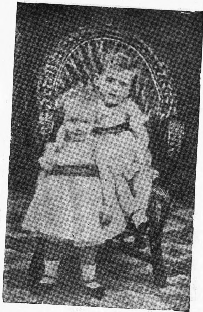
Ο Βασιλεύς Κωνσταντίνος και ο αδελφός του Γεώργιος εις παιδικήν ηλικίαν