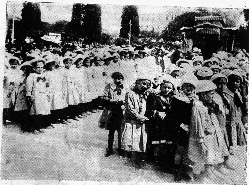
Το Προσκύνημα τῶν Σχολείων

πὸ τοῦ Νεκροῦ ἀπὸ τὸ Νοσοκομεῖον εἰς τῆς Θεσσαλονίκης τὰ Ἀνάκτορα. Καὶ ἦτο ἀπείρως τραγικὴ ἡ στιγμή ἐκείνη διὰ τὸν μάρτυρα Βασιλοπούδα καθ' ἣν μόνος, μακρὰν τοῦ οικογενειακοῦ περιβάλλοντος ἐδέχθη ἕνα νεκρὸν πατέρα εἰς τὰς ἀγκάλας του, καὶ κύπτων ἀπὸ τὸ βάρος τῆς ὀδύνης τοῦ πόνου, τῆς ἀγωνίας, εὑρισκε πρηγγορίαν ἀγρυπνῶν παρὰ τὴν κεφαλὴν τοῦ Μεγάλου Νεκροῦ.