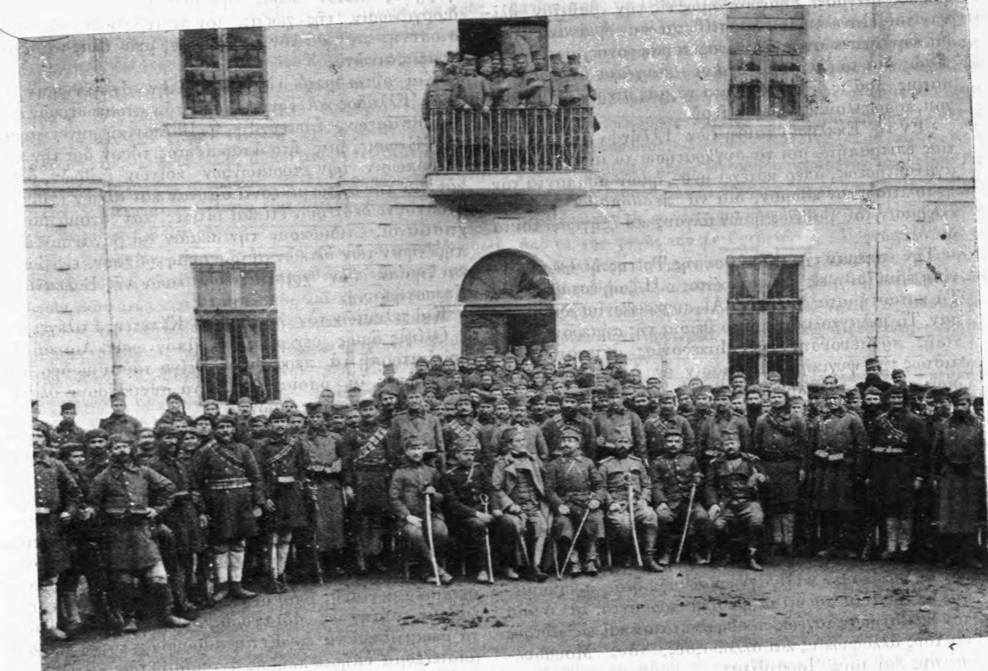
Ἑλληνας και Σέρβοι ἀξιωματικοὶ ἐν Φλωρίνῃ