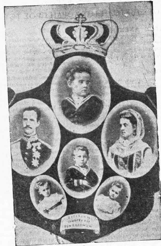
Η ΒΑΣΙΛΙΚΗ ΟΙΚΟΓΕΝΕΙΑ