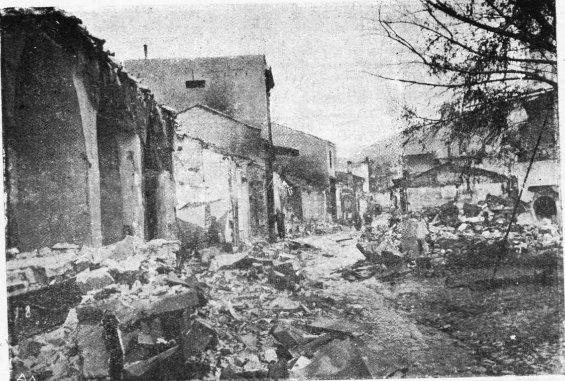
Η καταστραφείσα άγορά των Σεργών