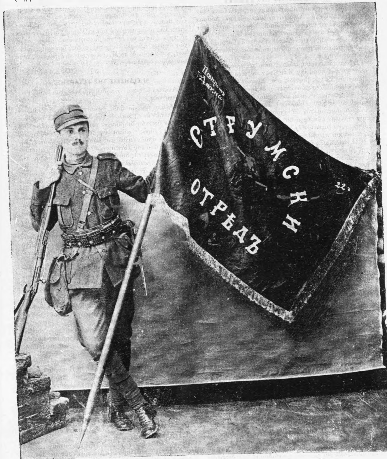
Σημαία Βουλγαρικῆς Ταξιαρχίας ἐπὶ τῆς ὁποίας ἔγραφον. «Ἐμπρὸς εἰς τὰς Ἀθήνας».

Ἡ εἰς τὸ δεξιὸν ἡμῶν εὐρισκομένη Μεραρχία ἐνισχυθεῖσα καὶ δι' ἑτέρων στρατευμάτων ἐβάδισε διὰ τῶν κυρίων αὐτῆς δυνάμεων διὰ τῆς ὁδοῦ Σερρών — Βροντοῦς πρὸς Τσέρνοβον ἀπέστειλε δὲ δύο μικρὰ