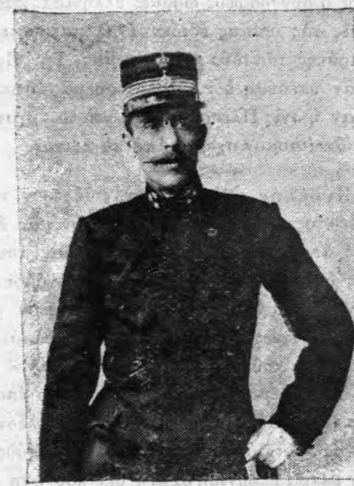
Γ. Ο. ΚΟΛΟΚΟΤΡΩΝΗΣ

Ἡ περαιτέρω συνέχεια τῆς ἱστορίας τοῦ θρησκευτικοῦ δράματος εἶνε κατὰ τὸ μάλλον γνωστὴ. Ἐν Ἀγγλίᾳ τοῦτο ἐξηφανίσθη ἐντὸς τῆς ἀμώπειδος τῆς ἠθολογίας καὶ τῶν λοιπῶν σχολαστικισμῶν. Τὸ νέον Ἀγγλικὸν δρᾶμα ἐξελίχθη ὑπὸ τοὺς Ἰακώβους καὶ τοὺς Καρόλους εἰς ἄλτοῦν μέσον διασκεδάσεως, ἡ δὲ ἐποχὴ τῆς καλινορθώσεως εὗρε τοῦτο πᾶν ἄλλο ἢ συνδεόμενον πρὸς τὴν καθημερινὴν ζωὴν. Τὸ οἱ τὸ σφάλμα τοῦτο δὲν ὀφείλετο ἀποκλειστικῶς εἰς αὐτὸ τοῦτο τὸ δρᾶμα, δυνάμεθα νὰ συμπεράνωμεν ἐκ