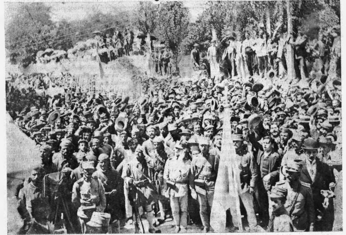
Τὸ πλῆθος καὶ ὁ στρατὸς εἰς τὴν Καβάλλαν ζητωκραυγάζοντες τὸν Βασιλέα

Τὸ δὲ ὄνομα τῆς Μοσχόπολεως, κτισθείσης τὸν δέκατον τέταρτον ἢ τὸν δέκατον πέμπτον αἰῶνα, ἀποκαλύπτει εἰς ἡμᾶς ὁλόκληρον ἱστορίαν τῆς ἐμπορικῆς, βιομηχανικῆς καὶ πνευματικῆς ἀναγεννήσεως τῶν Ἑλλήνων τῆς προηγηθείσης τῶν ὑπὲρ ἀπελευθερώσεως ἀγώνων. Τὰ ἐν αὐτῇ ἐργοστάσια ταπήτων καὶ ὑφασμάτων, περιζήτητων ἐν ταῖς χώραις τοῦ Αἴμου καὶ ἐξαγομῆτων μέχρι τῆς Ἀστροῦρας καὶ τῆς Οὐγγαρίας εἶχαν καταστήσει τὴν πόλιν ταύτην πλουσίαν καὶ εὐημεροῦσαν ἠρήθιμει δὲ τοῦλάχιστον ἐξήκοντα χιλιάδας κατοίκων. Κλῆρος λόγιος, ὁργανωμένος ἐπὶ τῇ βάσει καταστατικοῦ εὐσυντάκτου, ὑπογεγραμμένου ὑπὸ ἑβδομήκοντα καὶ τριῶν ἱερέων τῷ 1813, σχολεῖα ἑλληνικὰ ἀνθούοντα, παιδευτήριον ἀνώτερον καλούμενον Νέα Ἀκαδημία καὶ συσταθῆν τῷ 1744, ἐν τῶν πρώτων ἑλληνικῶν τυπογραφείων, ἰδρυθῆν τῷ 1720, καὶ ἱκανὸς ἀριθμὸς λογίων ἀποδεικνύουσι τὰς προόδους τοῦ πνευματικοῦ βίου τῶν πλουσίων ἐκείνων Ἑλλήνων βιομηχανῶν καὶ ἐμπόρων. Τὰρχεῖα τῆς Βουδαπέστης καὶ τῆς Βιέννης εἶνε πλήρη ἐγγράφων μαρτυρούντων τὴν βιομηχανικὴν αὐτῶν καὶ ἐμπορικὴν δρα-