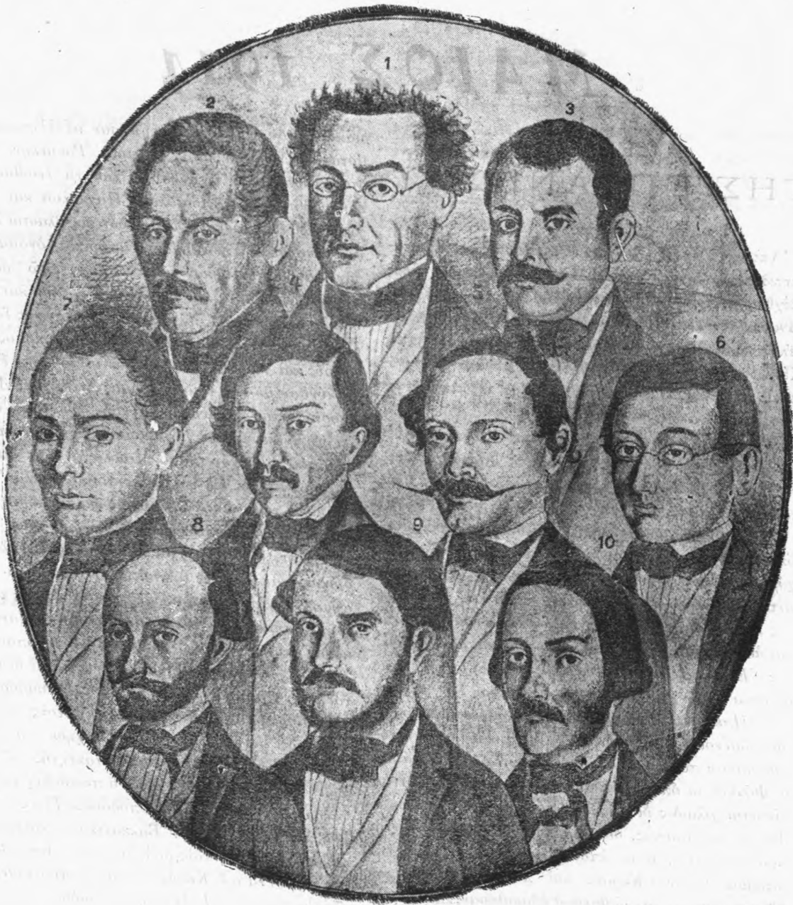
Αί μορφαί των βουλευτιών ριζοσπαστιών, ο'τινες εκήρξαν τήν ένωσην επί της 9ης βουλευτικής περιόδου.

νικώτατος Γούλφορντ, Άγγλος τήν καταγωγήν άλλα Έλληνα τήν ψυχήν. Τόσον φιλοερα ήτο ή προς τήν Έλλάδα αγάπη του, ώστε και έθελδοξας έδραπέστη και εις τήν εκπαίδευσιν της Έλληνικής νεολαίας αριέρωσε τὰ πλουτή του. Έν μέσω των κρίσιμων ήμερών του Γένους, ο ευγενής ούτος άνήρ έβλον τον ένθουσιασμόν του και έβλην τήν εύέλπιδα αίσιοδοξίαν του συνεκέντρωσε προς τήν Έλληνικήν φυλήν.