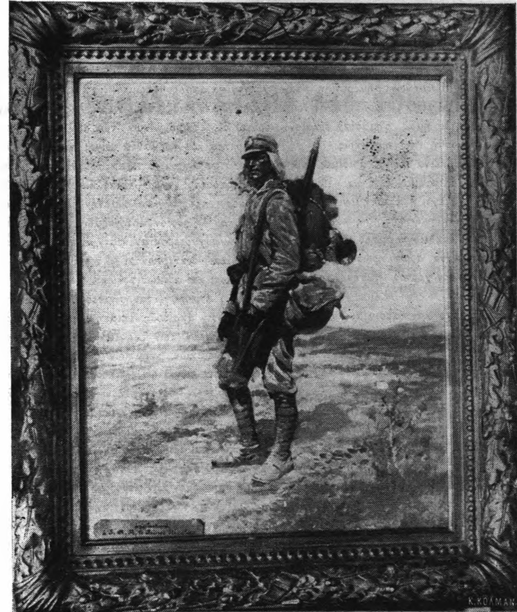
Ο ΕΛΛΗΝ ΣΤΡΑΤΙΩΤΗΣ