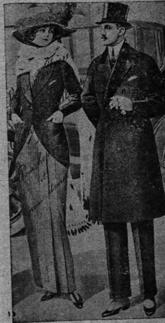
49. — Πανεπιστημίου — 49.