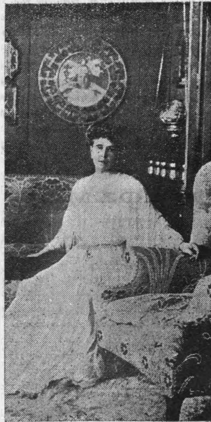
Η πριγκήτισσα Μαρία, μήτηρ της πριγκηπίσσης Έλισάβετ της Ρουμανίας μέλλουσα πενθερά του Διαδόχου μας Γεωργίου.