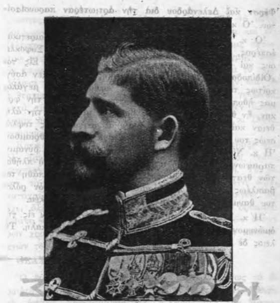
Ο νέος βασιλεύς της Ρουμανίας Φερδινάνδος