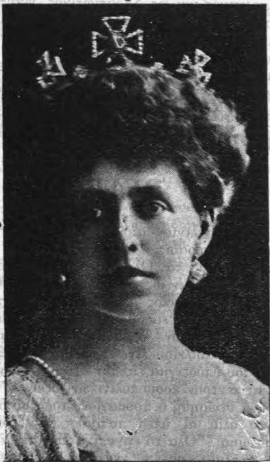
Η νέα βασίλισσα της Ρουμανίας Μαρία

Ό θαυμασμός και ή συμπάθεια κάθε Έλληνοσ- τρέφεται ακράτητος προς τον ήρωϊκόν Λαόν τού Βελγίου και αί εύχαι μας θερμαί εκπέμπονται υπέρ τής ταχείας άποκαταστάσεώς του.