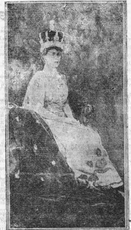
Ἡ Βασίλισσα τῆς Ἀγγλίας

— Ἡ «Ζοκόντα» εἰς ἓν σκοτεινὸν ὑπόγειον.