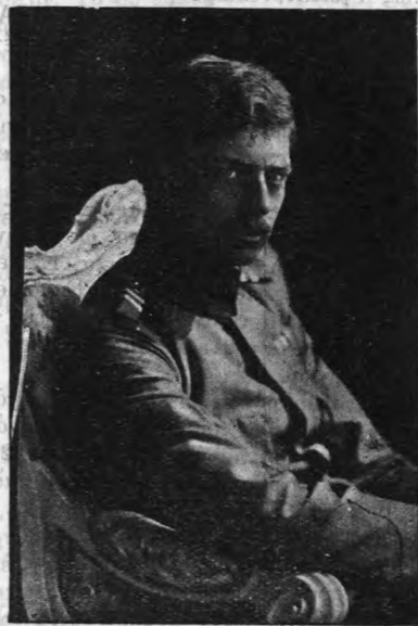
Ο Διάδοχος του Ρουμανικού θρόνου

«Δέν πρόπει ν' άτασχολήσθε σήμερον από τά Βελ- γάνια ή από τó Μαρόκον, αλλά να διατηρήσετε τήν ενεργητικότητα σας και τās δυνάμεις σας διά την Γαλλίαν. Η Γαλλία πρόπει να παρασκευασθί ταχέως πρό παντός να εινε έτοιμον τó ναυτικόν και ό εναερίος στόλος. Κατά τās πρώτας ήμέρας του 1914 ή Θεία Δικαιοσύνη θά πλήξη την Αυστριαν. Άπάτητα θά διαπραχθί. Θά ρεύση Βασιλικόν αίμα θά επίζητηθί ή άποφυγή νέων άποπειρών κατά των μελών τής Βα- σιλικής οικογενείας, ήτις θά διασπαρή εις τά τέσσαρα