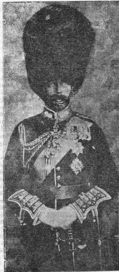
Ὁ Βασιλεὺς τῆς Ἀγγλίας

— Ἡ «Νίκη τῆς Σαμοθράκης» ἐκρύβη εἰς τεθωρακισμένον δωμάτιον τοῦ Μουσείου.