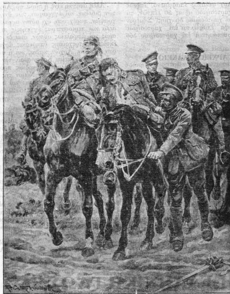
Μετά την έφοδον.

Τ' άντίγραφα διαφόρων πράξεων, κατά την Ιόνιον νομοθεσίαν, όσα επαφίνοντο εις τούς πολίτας, τη αίτήσει αυτών, έγέγοντο επί χαρτοσήμου δ' ή ε' τάξεως και τοῦτο κατά την φύσιν τών αίτουμένων άντιγράφων. Επειδή όμως μετά την άφομοίωσιν ήγνοείτο ή αξία του προς τόν σκοπόν τοῦτον χαρτοσήμου και επειδή ή Νομαρχία Ζακύνθου ύπέμνησεν εις τόν Αρχιφύλακα, κατόπιν άναφοράς του προς αυτήν, τόν περί χαρτοσήμου Νόμον, έκδοθέντα παρά τών Ράλλη και Ποτλή και επειδή τέλος ο νόμος οῦτος δεν απέβλεπε ποσώς τά Αρχιφύλακα, μη ύπαρχόντων τοιοῦτων έν Ελλάδα, ο Αρχιφύλαξ διεβίβασε προς τόν Εισαγγελέα άναφοράν από 6 Απριλίου 1866, δι' ής έξίτηι να τῷ γνωσθί επσημως ποίαν τάξιν χαρτοσήμου ώφειλε να μεταχειρίζηται έν τῷ Αρχιφύλακείῳ, ο δε Εισαγγελέας απήντησεν εις αυτόν, ότι, κατά τό άρθρ. 24 § 13 του περί χαρτοσήμου Νόμου, τ' άντίγραφα όσα δημοσίαις Αρχή, τη αίτήσει ιδιωτών, έξέδιδεν, ύπέκειντο εις χαρτοσήμιον δραχμής, κατά δε την ύπ' αριθ. ΡΙΣΤ', περί μεταρρυθμίσεως του περί χαρτοσήμου Νόμου εγκύκλιον, τά δικαστικά έν γένει τῷ χαρτοσήμιον