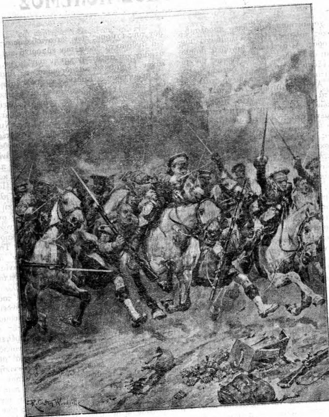
ΕΦΘΑΟΣ ΠΡΟ ΤΟΥ ΣΑΙΝ-ΚΕΝΤΕΝ