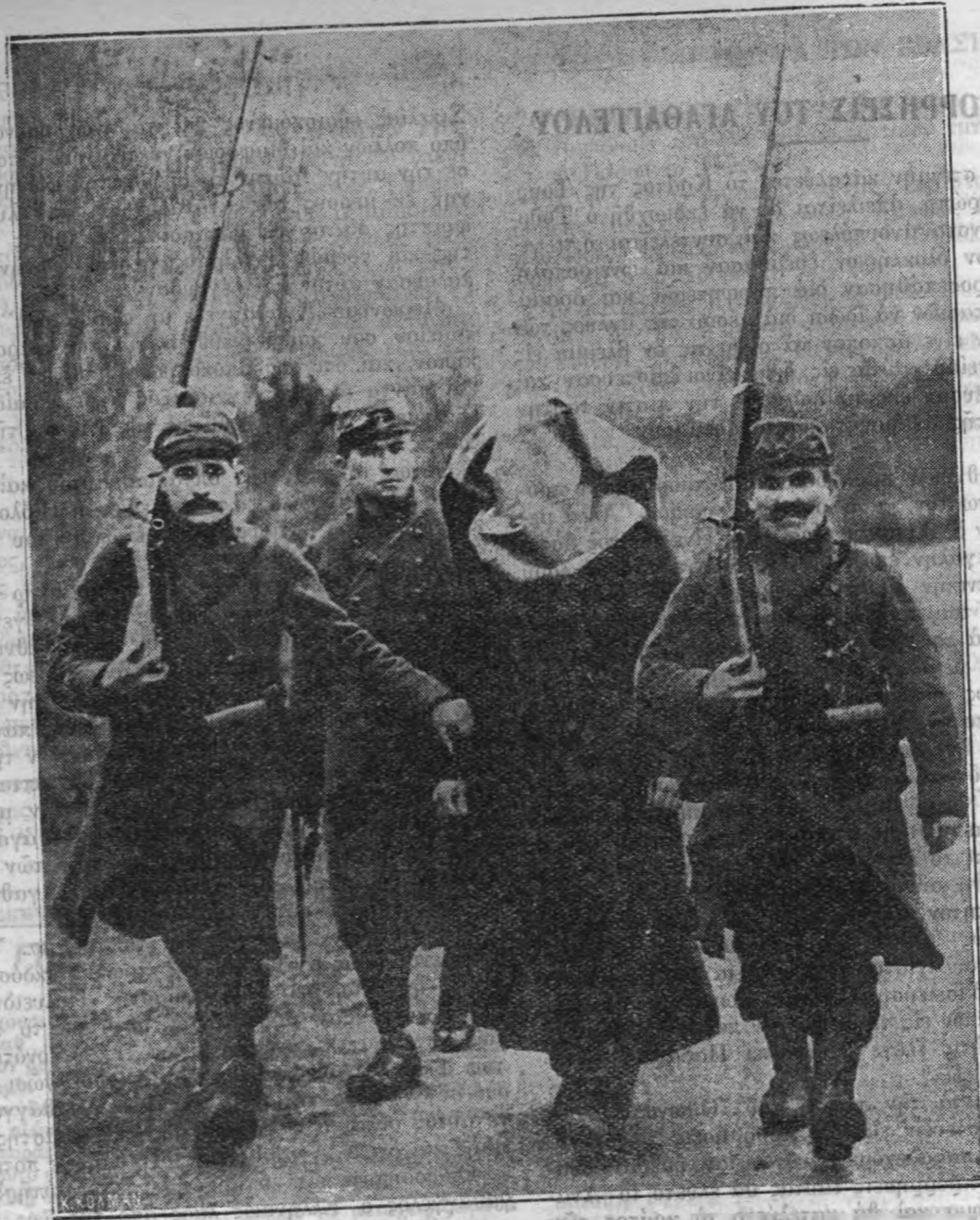
Συλληφθεὶς ὁ Γερμανὸς κατάσκοπος, ὀδηγεῖται ὑπὸ Γάλλων ἐθνοφρουρῶν, με κεκαλυμμένον τὸ πρόσωπον εἰς τὸ ἐγγύτερον στρατηγεῖον, πρὸς ἀνάκρισιν