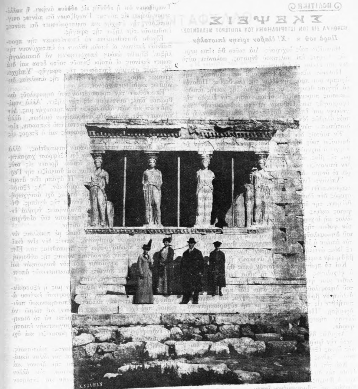
Οἱ ΠΕΡΙΗΓΗΤΑΙ ΠΡὸ ΤΟΥ ΕΡΕΧΘΕΙΟΥ