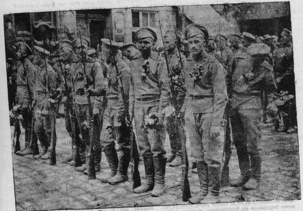
Οι Άγγλογάλλοι στη Θεσσαλονίκη