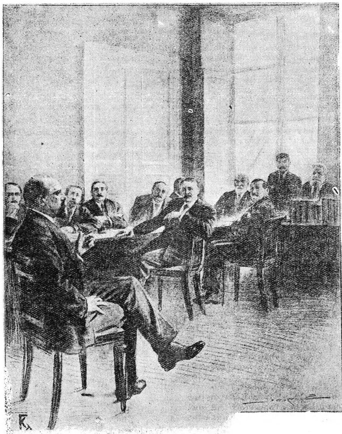
Κοινοβουλευτική πολεμική Έπιτροπή τῆς Γαλλίας