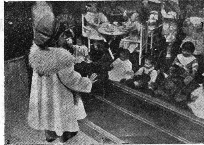
Το μαρτύριον του Ταντάλου.