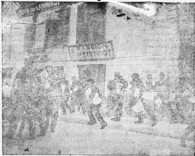
Οἱ ἐφημεριδοπώλα τοῦ Πρακτορείου τοῦ Ἑλληνικοῦ Τύπου διακαλοῦντες τὸ «Πανόραμα»