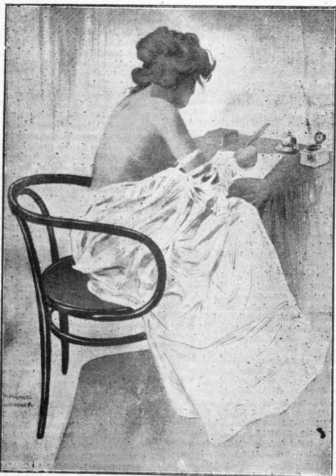
ΤΟ ΠΡΩΤΟ ΕΡΩΤΙΚΟ ΓΡΑΜΜΑ