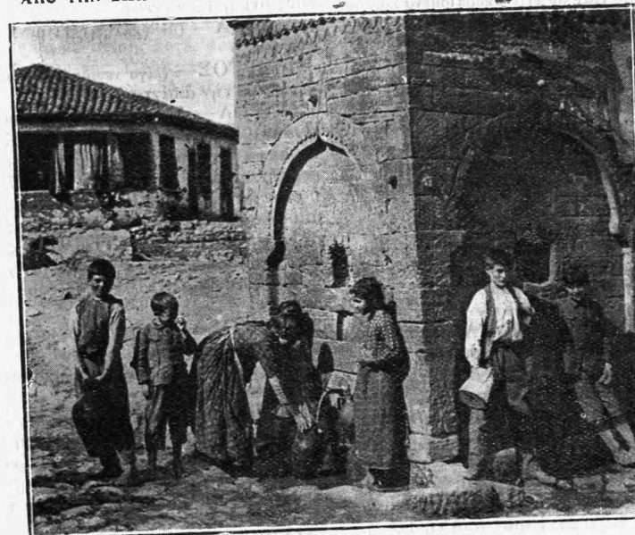
ΕΙΣ ΤΗΝ ΒΡΥΣΙ ΤΟΥ ΧΩΡΙΟΥ