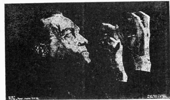
Μια χαρακτηριστική σκηνή του έργου «Τα χέρια του 'Ορλιάν» εις τό όποιον πρωταγωνιστεί ό μεγάλος Κόνρατ Φάιντ.