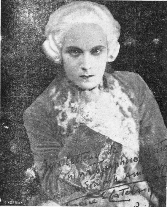
Ο κ. Ζακ Κατλαίν εις τόν ρόλον του Οκταβίου

Η συμπεριφορά της όμως αυτή άρχίζει να σχολιάζεται δυσμενώς εις την Αύλην, και η Έπιτροπή επί τών Ηθών θέτει τό Μέγαρον της Στραταρχίνας υπό έπίβλεψιν. Ο Βαρώνας Όεφον Λαρχενο, έξάδελφος της Στραταρχίνας. Έπ εις την Καρινθίαν, εις τό καταχερσώμενα κτήματά του. Η πλουσία κόρη του μεταπολεμικού νεοπλούτου Φάνιναλ τόν προσέβουετα. Ο Βαρώνας διά τό έξασφαλισμό τό μέλλον του, επιστρέφει με όλην την υπεροίαν εις τηνΒιέννην.