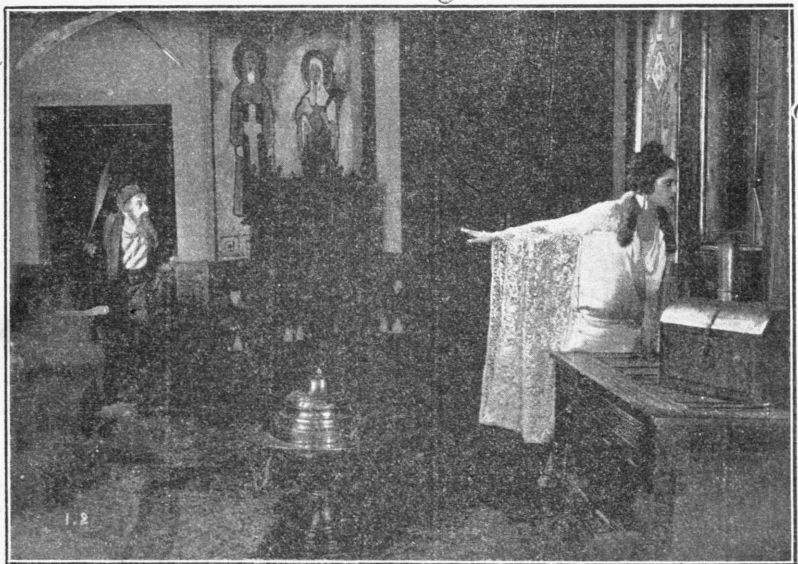
Μία σκηνὴ ἀπὸ τὸ ἔργον «Ἡ κατάσκοπος μὲ τὰ μαύρα μάτια» τὸ ὁποῖον θὰ προβληθῆ προσεχῶς εἰς τὸ «Σπλέντι»

ἐλαφρῶν ἠθῶν τὴν ὁποίαν ἐν τούτοις ἠγάπα ὁ Ἀλλαιν χωρὶς νὰ ἀποδεικνύει τὸν ἐρωτὰ τοῦ. Ὁ Βίκτωρ παρασχεθεὶς ἀπὸ τὰ θέλητρα τῆς χορευτριάς ἡ χρεὼν νὰ φερατῆρῃ μαζὺ της, χωρὶς ὁ Ἀλλαιν νὰ ἀνισταθῆ εἰς τὰς ιδιοτροπίας τοῦ φίλου του προτιμῶν νὰ ὑποφέρῃ αὐτὸς παρά νὰ ἀποκαλύψῃ τὸν ἐρωτὰ τοῦ. Ἐνα βράδῳ ἡ Μπέσσι ἐπιστρέφουσι ἐπὶ σπιτί της εὐχρηκε κλειστή τὴν ἐξώθυρον. Ὁ πατέρας της Νιάν Ἰρβιγκ ἀνεύθυνος αὐτῶν ἠθῶν καὶ κακὸς τῆς ἐδήλωσεν αὐτῇ ὅτι θὰ εὐρίσκει τὴν πόρταν κλειστὴν εἰς περιπτώσιν κατ' ἠν θὰ ἐπέστρεφε μετὰ τὰς 11. Ὁ Ἰρβιγκ ἦτο ἐκ φανεροῦ σκληροῦ χαρακτήρος ἐτυράννει δὲ ἀνηλεῶς τὸσον τὴν κόρη του ὅσον καὶ τὴν σύζυγόν του. Ἡ Μπέσσι δὲν ἠδύνατο νὰ φαντασθῆ ὅτι ἡ σκληρότης τοῦ πατέρος της θὰ ἐφθάνει μέχρι αὐτοῦ τοῦ σημείου. Ἐγκαταλειμμένη καὶ ἐρημνία σὲ τὸ δρόμον καὶ μὲ δυνατὴ βροχὴ ἡ Μπέσσι ἤρχισεν νὰ κληῖθ ἀπὸ τὴν ἀπελπίστικὴν. Ἐυτυχῶς δι' αὐτὴν, ὁ Βίκτωρ ὁποῖος ἐκείνην ἠγάπα περισσότερο ἀπ' ἐκεῖ τὴν παρέλαβε καὶ τὴν ὠδήγησε σπῆτι του. Ἐκεῖ τὴν ἀφῆκε κατ' ὅλην τὴν νύκτα ὑπὸ τὴν ἐπιβλεψὴν τῆς γρηναίας τοῦ ὑπηρετητῆς ἡ ὁποία κατόχου εἰς τὸ ἀνω πάτωμα. Κατὰ δυστυχίαν ἡ ὑπηρετριά ἐλείπε ἐκεῖνο τὸ βράδῳ μετὰ τὴν ἀποβίβασιν εἰς τὴν κόρην της ἡ ὁποία συνέπεισε νὰ εἶναι ἀφορηστικὴ καὶ ἀτυχετὴ. Μπέσσι χωρὶς νὰ τὸ ὑπέλπιεν εὐρῆθι μόνον εἰς τὸ σπῆτι τοῦ Βικτωρος ὅλη τὴν νύκτα. Ἡ νεότης ποῦ ὀργιᾶ πάντοτε ἀπὸ τῶν δὲν δὲν κατώρθωσε νὰ συγκαταστήσῃ ἐκεῖνο