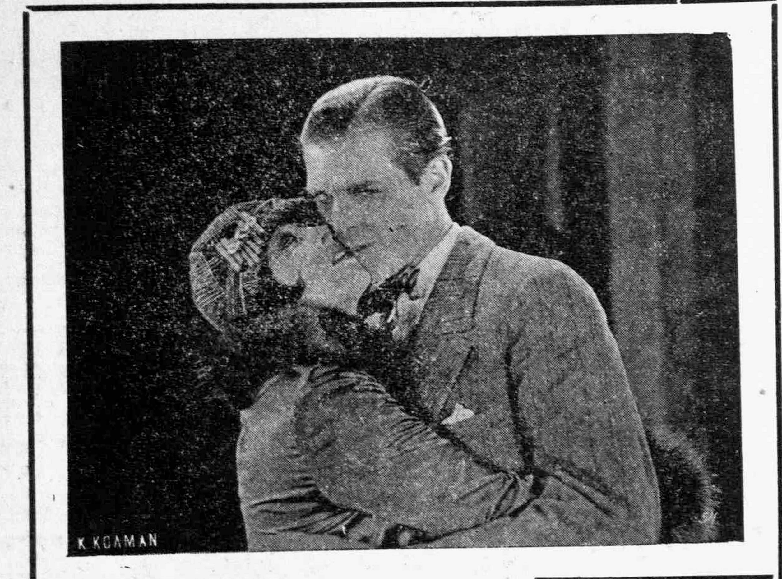
Μία σηνή ἀπὸ τὸ ἔργον «Ἡ πού γυναίκες παίζουν μὲ τὴν καρδιά» πού προσβλήθη κατὰ τὴν παρελθούσαν ἐβδομάδα εἰς τὸ «Σπλέντι» μὲ μεγάλην ἐπιτυχίαν.

Ἀνεξήτησεν εἰς τὴν μνήμην του. Ἀνεξήτησεν ἐπὶ πολὺ καὶ ἐπὶ τέλος ἐφώναξεν πρὸς μεγάλην χαρὸν τοῦ δημοσιογράφου, ὁ ὁποῖος εἶχε ἀρχίσει νὰ χάνῃ τὴν ὑπομονὴν του: