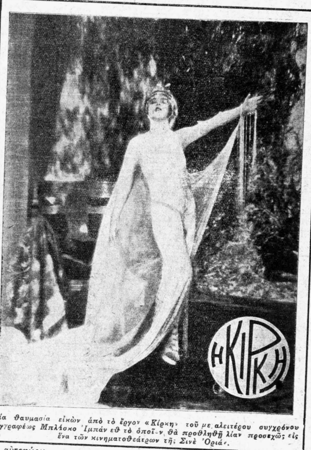
Μία θαυμασία εἰκόνα ἀπό τὸ ἔργον «Κίρκη» τοῦ με. λειτέρου συγχεῖνον συγγραφέως Μπλόσκο Ἰμπάν ἐπὶ τὸ ὄποιον θά προηγήθῃ λίαν προσεχῶς; εἰς ἓνα τῶν κινηματοθεάτρων τῆς Σινὲ Ὀριά.