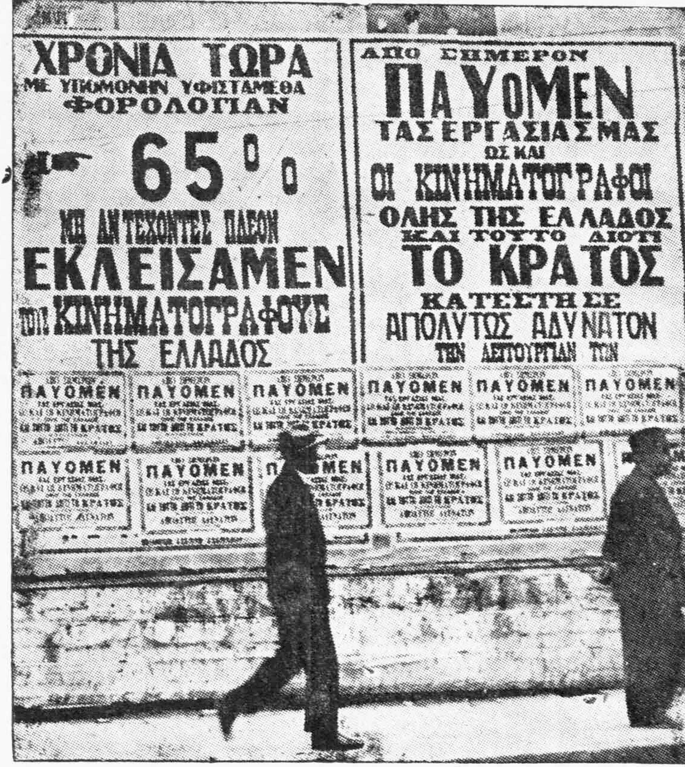
Αἱ τοιχοκολληθεῖσαι εἰς τοὺς Ἀθηναϊκοὺς δρόμους ἐπιγραφὰι διαμαρτυρίας τῶν κινηματογραφικῶν ἐπιχειρήσεων

Τὸ ἠθικὸν τῶν ἀπεργῶν Παρὰ τὰ ὑπὸ τῶν ἐφημερίδων ἀναγραφόμενα σχετικῶς μετὰ τὴν ἐξέλιξιν καὶ τὴν τύχην τῆς ἀπεργίας τῶν κινηματογράφων, οἱ ἀπεργοὶ καθ' ἅπασαν τὴν Ελλάδα ἀπέδειξαν ἀξιοθαύμαστον καρτερικότητα καὶ σθένος. Ἐκατοντάδες τηλεγραφημάτων ἀπε-