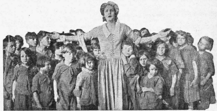
Μία σκηνὴ ἀπὸ τὸ μεγαλειώδες ἔργον «Μητροπόλις» ποὺ θὰ προβληθῆ λίαν προσεχῶς εἰς τοὺς κινηματογράφους Ἀττικῶν καὶ Μοντιὰλ.

Αὐτὸς ἦτο ὁ τελικὸς σκοπὸς τῆς. Ὁ Μπλοέκε πεθαίνει. Ἡ Ἑλένη ἐξοκότως τὸν ἐχθρὸν τῆς πατρίδος τῆς καὶ κλαίει ἀπαρηγόρητα τὸν ἔραστήν.