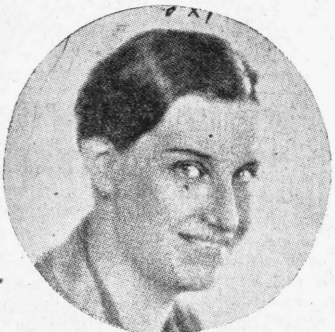
ΤΕΑ ΦΟΝ ΧΑΡΜΠΟΥ

Ἡ στολή τῶν εἶναι βεβαίως Ἱταλική. Ἡ νῆσις μὴ, κομμωτογραφικῶς δηλαδὴ ἢ ἐγγαλ. Ὅσον περὶ τῆς ὁμορφίας αὐτοὺς εἶναι ντυμένοι μὲ μακρὸν τὸν σάτυρον τὸν μανδύαν ἀπὸ