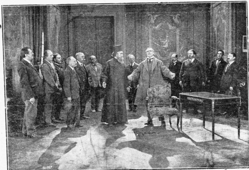
Σκηνή από τό έργον «Η κατάσκοπος με τά μαύρα μάτια» που έκράτησε επί δεκαπενθήμερον δέ συγγινύδ. τούς Αθηναίους.

Αλλά παρ' όσαν ήθικην υπεραραχήν, περιεπλέχθη και ή Κάρολα με την σειράν της εις μίαν συζυγικήν άπιστίαν. Αγαπά τόν Μάξ, τόν υιόν του έμπορικου συμβούλου Τερμέλεν, φίλον επίσης του οίκου Βαίσεγκερ. Πώς δύναται ήδη αύτη, ή κοπομένη υπέρ της ήθικής, ή φοβουμένη την σκαίήν της, να κατορθώση να συναντηθή άπικρατήρητος, μετά του άγαπημένου της; Και άνεπίδοτος της επέσχεται ή φαινή ιδέα. Η Ντόριτ ή όποία άλλως τε έρωτοτροπεί με όλον τόν κόσμον και της όποίας ή υπόληψις δεν έχει πλέον και πολλά πράγματα να χάση, πρέπει να άρχίση ένα ψευτοφρόν με τόν Μάξ. Και τοιουτοτρόπος θα ήδύνατο ή Κάρολα χωρίς να διχθή τό καλόν της