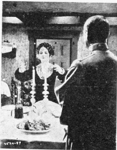
Η Μαίρη Φιλκμαν και ο Ίβαν Μοζζούκιν εις τό τελευταίον τους έργον «Η Θυσία». Θα προβληθή προσεχώς εις τό «Αττικόν».

Εν τέλει όμως πείθεται και συμφιλιώνεται με τόν άνεψιόν της τόν όποιον και καθιστά κληρονόμον της περιουσίας της.