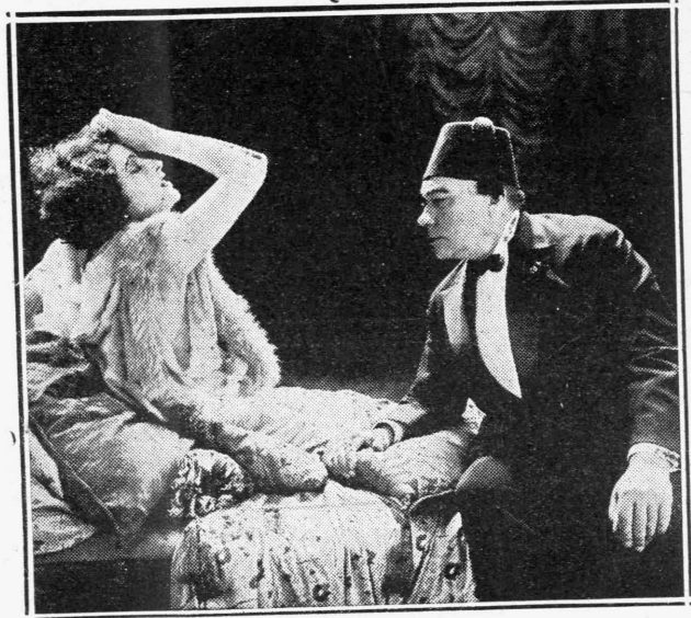
Ό Πάουλ Βαγκένερ και ή Μαροδάλλα Άλμπάνι εις μίαν σκηνήν του έργου «Ντάγκβιν» που προβάλλεται καθ' όλην τήν τρέχουσαν έξβομάδα εις τό «Μοντεάτλ».

Έντός ολίγου εξαφανίζεται ή σιλουέτα της. Τά ώραια και μεγαλόψυχα βουνά θά τόν επανακλήσουν, θά τόν περιθάλλουν, θά τόν παρηγορήσουν, θά ζήσῃ πλησίον του πάππου του και του άνεπιφού του. Ψυχαι άξεστοι και γεμάτα μεγαλειον, καθυστατημένα εις μίαν άνθρώποτητα τήν όποیان θά εξαφανισή έντός ολίγου ή άδυσλόπιτος πρόδοσις.