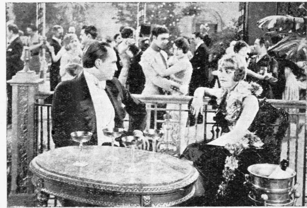
«'Ο Κόνρας Φάιντ εις μίαν σκηνήν του έργου «Τò Παρελθόν» τò όποιον προβάλλεται την τρέχουσαν εβδομάδα εις τ' «Αστίκον».

φή του Λαρός χωρίς όμως αυτό να έμποδίση να γεννηθί ένα αίσθημα μεταξύ τών δύο νέων. Κατά κακήν όμως τύχην εις τò 'Αλγεριον μετετέθη τότε και ό λοχαγός Ντεστέν ό όποιος εις μίαν συγκέντρωσιν άναγνωρίζει τόν Λαρός και έρωτεύεται την 'Υβόν. 'Ο Ντεστέν άπαιτεί από την 'Υβόν να τόν υπανδρευθί άπειλόν ότι εν έναντία περιπτώσει θα κατηγγείλη τόν Λαρός ός ένοχόν άσταντι τών φυλακών και θυποδόμενον