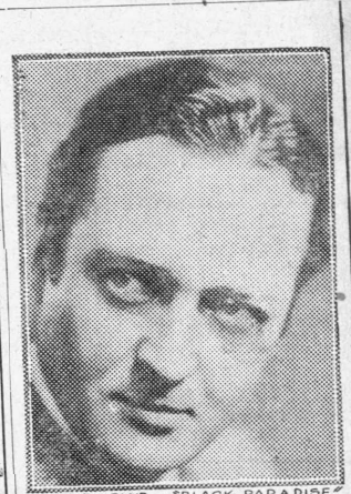
EDMUND LOWE in "BLACK PARADISE" A WILLIAM FOX SUPREME ATTRACTION

Ο Έντμοντ Λόβ ό πρωταγωνιστής του έργου Φόξ Φιλμ «Η νύχος του Παρία» (Black Paradise).