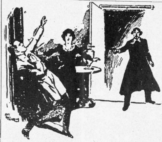
Μία σκηνή άπό τό νέον έργον του γόντου Μοζούκιν «Η Θυσία» ή «Ο κρητικός Κοζίκος» που προβάλλεται είς τό «Σπλέντετ».

— 'Ηθέλησα πρό παντός νά θέσω τής βίσεις της Γαλλικής κινηματογραφικής πολιτικής ούτως είπειν. Είναι γνωστόν, ότι δέν θά κατορθώναμεν τήν άναπαράστασιν Γαλλικών κινηματογραφικών έργων, έξω τών συνόρων της χώρας μας, όπως γίνεται διά τά θεατρικά μας έργα. Η Γαλλία έχει λαμπράν δραματικήν φιλολογίαν, εκτιμωμένη άπό τούς ξένους. Διατί, λοιπόν νά μη άποκτήσωμεν τήν αυτήν θέσαν και είς τήν όδόνην; Είναι άπαράδεκτον τό γεγονός ότι ή Γαλλία δέν κατέχει έξέχουσαν θέσιν είς τόν παγκόσμιον κινηματογράφον και δι' αυτό δέν είμεθα, νομίζω, ύποχρεωμένοι νά ρημολοκούμεθα άπό τούς 'Αμερικανούς, τούς Γερμανούς ή άπό όιονσδήποτε άλλους ξένους παραγωγούς κινηματογραφικών ταινιών. Βεβαίως, δέν δυνάμεθα νά ύποστηρίξομενδτι είμεθα τέλειον είς τήν κινηματογραφικήν ή τήν παραγωγικήν και ότι τά παιχθέντα μέχρι τούδε έργα άποτελούν άριστουργήματα. Είμαι, έν τούτοις, βέβαιος ότι σίν τώ χρόνφ θά επιτύχωμεν αυτά. Οί Γάλλοι συγγραφείς ήχησαν νά άσολοούνται και αυτοί με τόν κινηματογράφον, ώς έκ τούτου δέ ή πνευματική αξία της κιν-