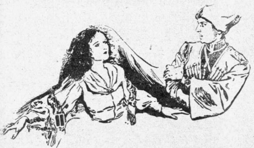
Μία σκηνὴ ἀπὸ τὸ νέον ἔργον τοῦ γόντου Μοζζούκιν « Ἡ Θυσία » ἢ « Ὁ Πρίγκιπ Κωζάκοβ » ποῦ προβάλλεται εἰς τὸ « Σπλένεντ ».

— Δὲν εἶναι τέλος πάντων ἀνυπόφορον; Τί λέτε;