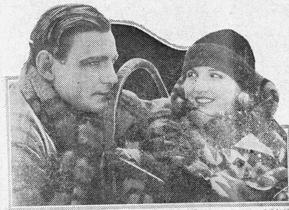
BUCK JONES and EVA NOVAK in "SO BELOW ZERO A WILLIAM FOX SUPREME ATTRACTION"

Ὁ Τζὰκ κατορθώνει νὰ πείσῃ τὴν Λάουρα νὰ λάβω- ν καὶ αὐτοῦ μέρος εἰς τὸ γλέντι τοῦ ξενοδοχείου. Ἐκεῖ ἐπι- ρίσκουσι καὶ τὸν Γκρέλιμαν μετ' τὴν φιληνθάδα τὸν Μό- λιντ. Ὁ Τζὰκ Στούρντρεβαντ ἐξηγεῖ ἄμφοσως εἰς τὴν Μόλυ σιγὰ διὸ τὴν τῶρα φέρῃ τὸ ὄνομα Τὸμ Πούουλι καὶ ὅτι ἡ μικρὴ ἐξυμνητὸν συνοδεύει λέγει πῶς εἶναι χήρα του. Ἡ Μόλυ Μόντν ἀρχίζει νὰ ἀνακρινῇ τὴν Λάουρα πῶς ὑπανδρῶ- θῃ τὸν Στούρντρεβαντ δταν τέλος αὐτὴ δὲν ἤθελοῖ πῶς νὰ σωθῆ ἀπὸ τὰς ἐρωτησεις, τὴν βοηθεῖ ὁ νέος χροῖος διότι κινεῖ ἀ- κριβῶς μεσάνυκτα. Πρὸς μεγάλην ὁμοσ ἀτυχίαν λαμβονει μέρος εἰς τὸ ἴδιο γλέν- τι καὶ ὁ μεγαλύτερος δανειστής τοῦ πα- τός τῆς. Μόλις ἐβίθε τὴν Λάουρα μετ' ὅ- σοιο πλουσία καταλείπει θέλει νὰ τὴν ὑ- βολεῖσι διὸ ἐνδέθηται ἕως κομῆν καὶ δὲν πληρωθεῖ τὰ χρεῖα της. Πῶν διως γίνῃ αὐτὸ καὶ ἡ Λάουρα διὰ νὰ σωθῆ λιπο- θυμεῖ ψευδῶς καὶ ἔτσι σωζεται ἀπὸ δια- τις κακιεῖ τῶν ἀνθρώπων ποῦ ἐπασαν ἐπάνω εἰς τὸν δυστυχῆ αὐτὸ πλάσμα. τῆς ἐπομένην καταφθάνει ὁ πατήρας τῆς Λάουρας μετ' ὁ συμβόλαιον. Ἡ Λάουρα ὁ- μως τοῦ ἐξηγεῖ ὅτι χρεῖς ἐγνωρισῃ ἕνα κύριο Τὸμ Πούουλι τὴν ἀγαπᾷ τόσο πολὺ καὶ δὲν θέλει νὰ εἰπῇ ψέματα διὰ νὰ μὴ χάσῃ τὴν ἐμπιστοσύνην τοῦ. Ἐξῆρας λοιπὸν ἕνα γραμματικὸν εἰς τὸν Γκρέλιμαν τοῦ ἐ- ξηγεῖ διὸ δὲν εἶναι αὐτὴ ἡ κυρία Στούρ- ντρεβαντ ἀλλ' ἔκανε αὐτὴν διὴ τὴν κατα- γορα διὰ νὰ καταθῶσῃ νὰ πάρῃ μῖα ἐνοχλή δι' ἕνα ἀραλιστικὸν συμβόλαιον, καὶ δραστηνεῖται ἀπὸ τὸ σπίτι Ὁ Τὸμ Πούουλι εὐφροδῆ γοῦμα τρέχει πίσω ἀπὸ τὸ ἀτοκιστικὸν γοῦμα τὸ φθάνει καὶ πη-