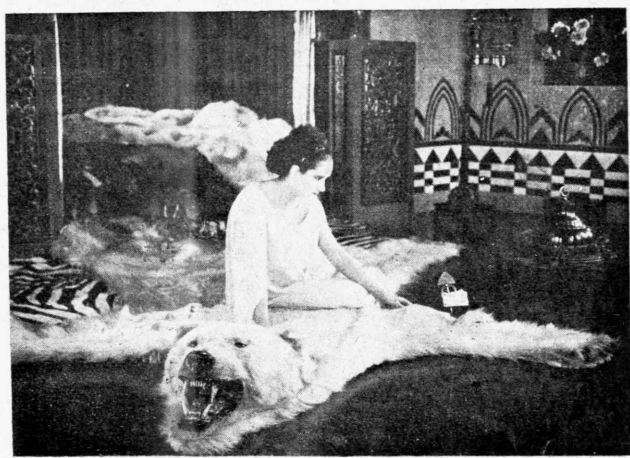
ΗΚλωντία Βικτριξ της όποίας συνέντευξιν δημοσιεύομεν εις άλλην σελίδα εις μίαν ώραϊαν σκηνήν του «Όκειανού» του Κισμαίεζρ όπου πρωταγωνιστεί με τίν συμπαιθή ζέγ πρεμιέν Ζάκ Κατλιάν

Αί εμφανίσεις της Άλλιαν Γκίς πρό του Κοινού μας, γενόμεναι κατά την τελευταίαν διετίαν διά τών έργων της «Λευκή Άδελφή», «Ρόμπολα», «Μποσν» και Ματωμένου Γράμματος», κατέταξαν αυτήν εις την συνέθειον του Κοινού μας μεταξύ τών κορυφαίων άστέρων του διεθνούς κινηματογραφικού στερωμάτος, προφανώς διότι ή Άλλιαν Γκίς είναι ή καλλιτέχνης ήτις μάς χαρίζει τās πλέον φυσικάς και ψυχολογημένας σκηνάς εις τās εκάστοτε εμφανίσεις της.