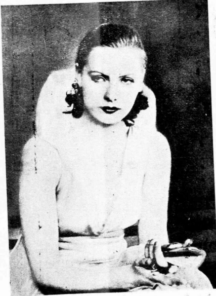
Μία χαρακτηριστική έκφρασις της Γκρέτα Γκάρμπο

Ω; θα ένθουμούται ό άνεγνωστός μου, έχον άττοληθί άλλοτε με έν σοβαρόν σκάνδαλον δοθέν δημοσιότητα παρά τίνος γυναικός, και άναφερόμενον εις την ιδιωτικήν ζωήν της καλλιτέχνης; ήν διείγεν εν Βερολίνω πρό της μεταβολσεώς της εις; 'Αμερικην. Κατεβλήθησαν προσάθειαι συγκαλύψεως του αιδίτης και ύπήρξαν άρρημη άθρόων συτήτησεν περϊ τό ήνμα της Σουηδικός βεντές. Ούτω δέ, σήμερον ή Γκάρμπο δέν είναι μόνον ή αντιπροσωπευτικώτέρα καλλιτέχνης της ρεαλιστικής σχολής του Κινηματογράφου, αλλά μία καλλιτεχνική κορυφή της όποιας ή ιδιωτική ζωή είναι προορισμένη ν' άφίση εποχήν εις τās χρονικά τής ποικιλομόρφου δράσεως.