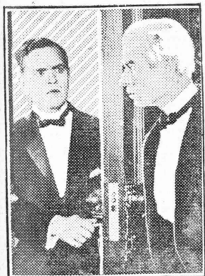
Scene from 'THE ACQUITTAL' Starring CLARE WINDSOR and NORMAN KERRY A UNIVERSAL SUPER-JEWEL