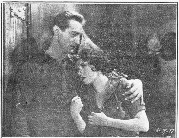
Ἡ Ρενὲ Ἀντορε καὶ ὁ Λουὶ Τέλλεγκεν εἰς μίαν σκηνὴν τοῦ ἔργου «Παρισινὲς Νύχτες» παραγωγῆς F. B. O. τῆς ὁποίας τὴν ἀποκλειστικότητα διὰ τὴν Ἑλλάδα ἔχει τὸ γραφεῖον τοῦ κ. Δ. Καρρά, Παρισίαν 12.

ΣΗΜΕΙΩΣΙΣ. Ὁ «Κινηματογραφικὸς Ἀστήρ» ἐγκαινιάζων ἀπὸ σήμερον τὸ ἀνωτέρω σύστημα, συμπληρώνει ἑνα σπουδαῖον κενὸν τῆς ἐμπορικῆς κινηματογραφικῆς κινήσεως τῆς Ἑλλάδος. Εἰς τὸν ἀνωτέρω πίνακα εἰς τὸν ὅποιον θὰ προστίθενται καθ' ἑβδομάδα τὰ προβαλλόμενα νέα ἔργα, θὰ εὐρίσκῃ καὶ ἐπιχειρηματίας Ἀθηῶν, Ἐπαρχιῶν καὶ Ἐξω-τερικῶν, ἕνα οὕτως ελεῖν, καθρέπτην τῆς ἐν Ἑλλάδι κινηματογραφικῆς κινήσεως, ἐκ τοῦ ὁποῦν δύναται πολλὰ νὰ ὠφελήθῃ. Ἐπιπλέον τὸ ἀνωτέρω σύστημα θὰ ἐξυπηρετῇ διὰ μόνον τοὺς ἐπιχειρηματίας τῶν ἐπαρχιῶν οἱ ὅποιοι θὰ γνωρίζουν πλεονεξ εἰς ποῖον ἀνήκουν αἱ ταινίαι, ποῖα καὶ πῶς ἔργα προσβλήθησαν, θὰ ὀδηγοῦνται περὶ τῆς ἀξίας των ἐκ τῶν δημοσιευομένων εἰς ἄλλην σελίδα κριτικῶν, ἀλλὰ καὶ τὰ ἐπιπλέον γραφεῖα ἐκμεταλλεύσεως τὰ ὁποῖα ὡς εὐνόητον πολλὰ ἔχουν νὰ ὠφελήθωσιν ἐκ τοῦ πλάνου τούτου.